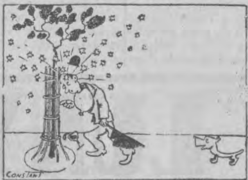
— Aha, już jestem, bo widzę gwiazdy.