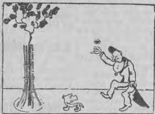
— Jak tu dojść do obserwatorium?