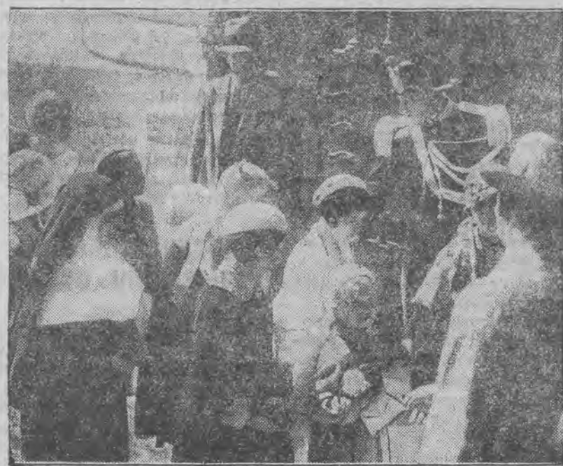
Zandarmeria włoska i detektywi watykańscy rewidują publiczność opuszczającą kościół.