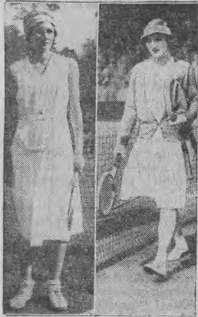
Na lewo: Panna Krahwinkel (Niemcy) i Helen Wills Moody (Anglia).