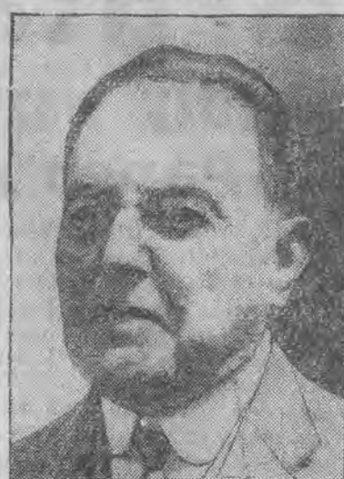
b. prezydent Argentyny zmarł po dłuższej chorobie.