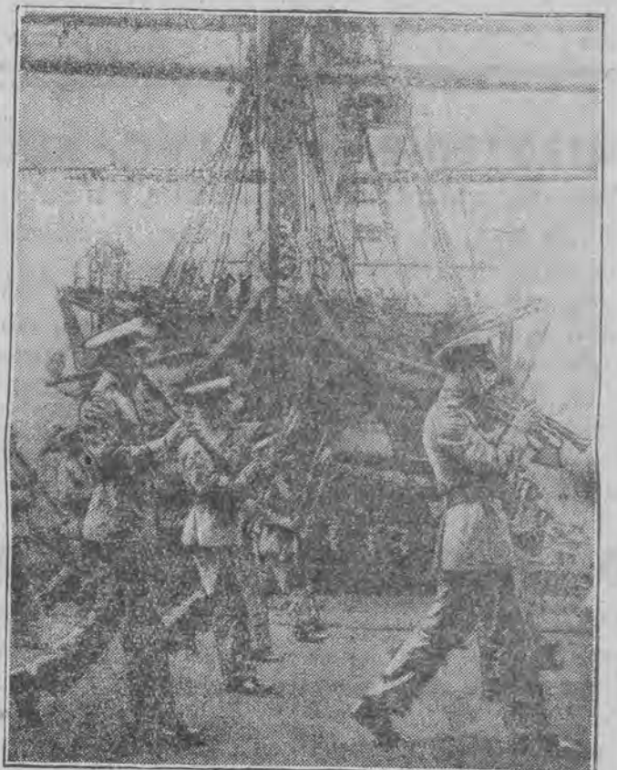
Oddziały marynarki królewskiej defilują w Plymouth przed okrętem Nelsona „Victory”, zachowanym z 18 wieku.