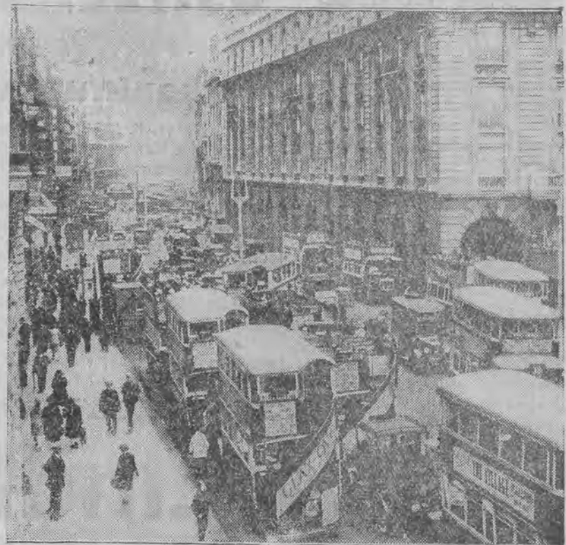
Picadilly, gdzie obserwuje się największe natężenie ruchu kołowego.