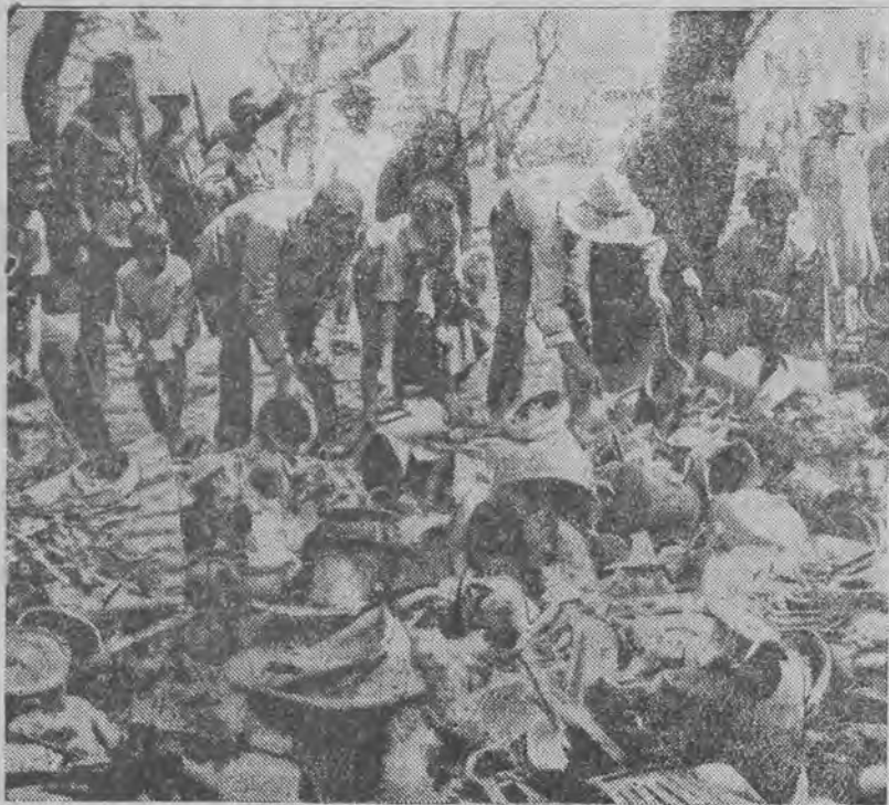
Miasto greckie, które dopiero w 1929 r. było ofiarą trzęsienia ziemi, padło pastwą pożaru, który zniszczył 400 domów w dzielnicy handlowej. 800 ludzi straciło dach nad głową. Zdjęcie nasze przedstawia mieszkańców Koryntu na zgłiszczach swych siedzib.