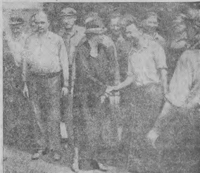
Sekretarz stanu w rządzie Roosevelta, pani Frances Perkins, odbyła podróż okrężną po stalowniach Pittsburga i wszędzie stykała się bezpośrednio z robotnikami, omawiając z nimi nową taryfę płac.