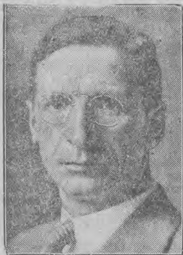
spowodował odwołanie marszu irlandzkich błękitnych koszul.