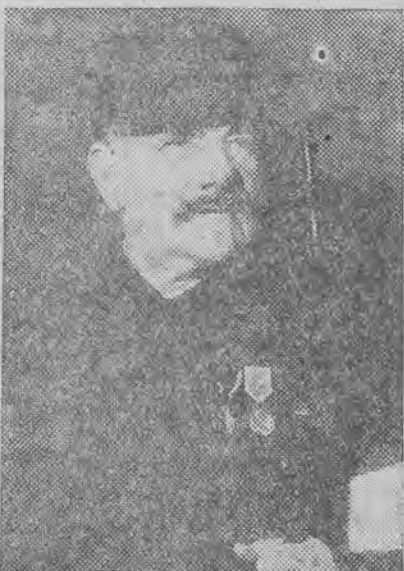
P. Svinhufvud pomimo swych 73 lat jest najlepszym strzelcem w swoim kraju.