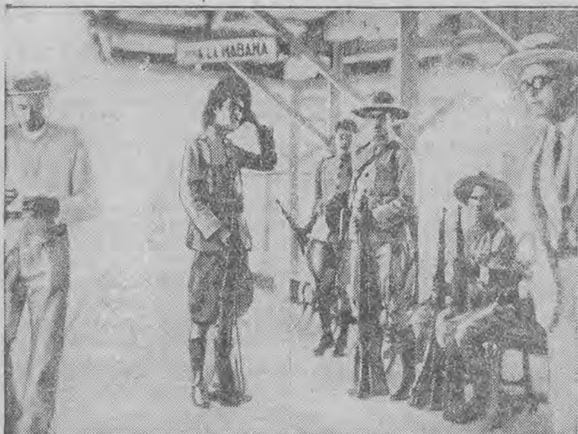
Wojska rewolucyjne obsadziły dworzec w Hawannie.