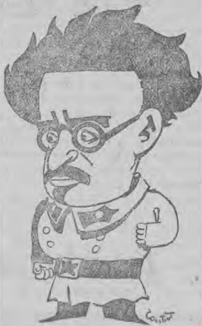
Czy Trocki powróci do Rosji?