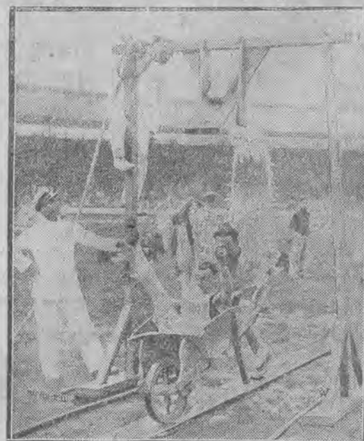
strażaków londyńskich, urozmaicone prysznicem.