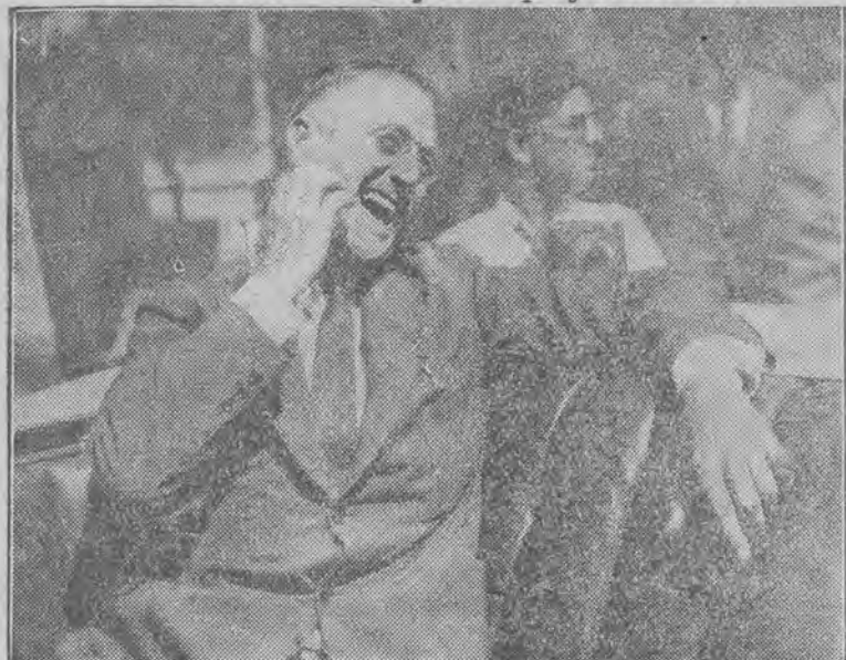
Fotograf zdjął prezydenta Stanów Zjednoczonych w jego rezydencji letniej w dość oryginalnej pozycji.