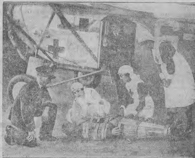
Zdjęcie nasze przedstawia angielski aeroplan sanitarny czerwonego krzyża niosący pomoc rannemu.