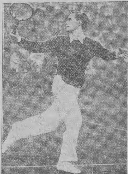
zdobyli mistrzostwo Niemiec w tenisie.