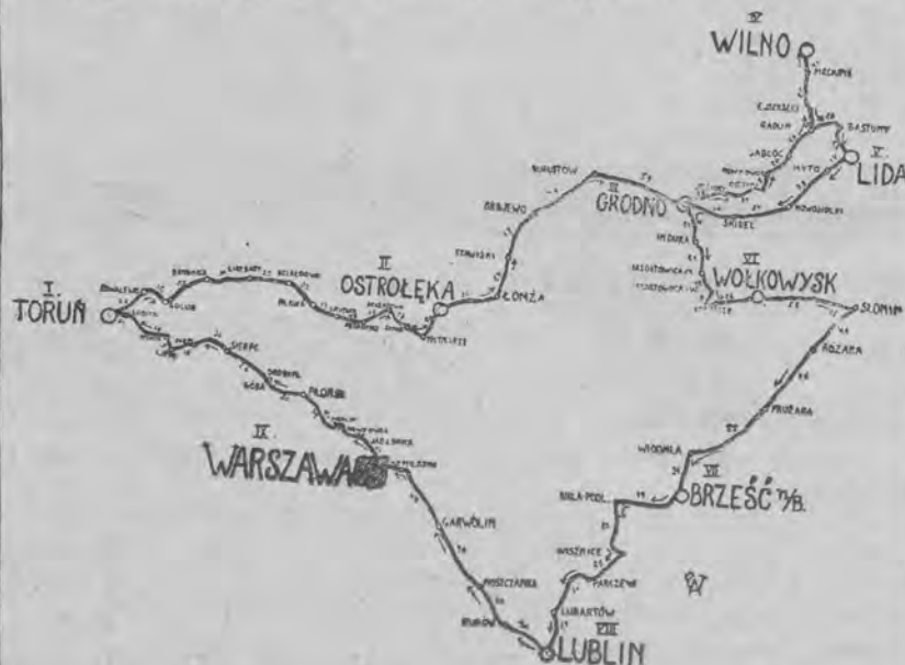
Trasa biegu kolarskiego dookoła Polski.

przebędą uczestnicy biegu dookoła Polski w ciągu 10 dni