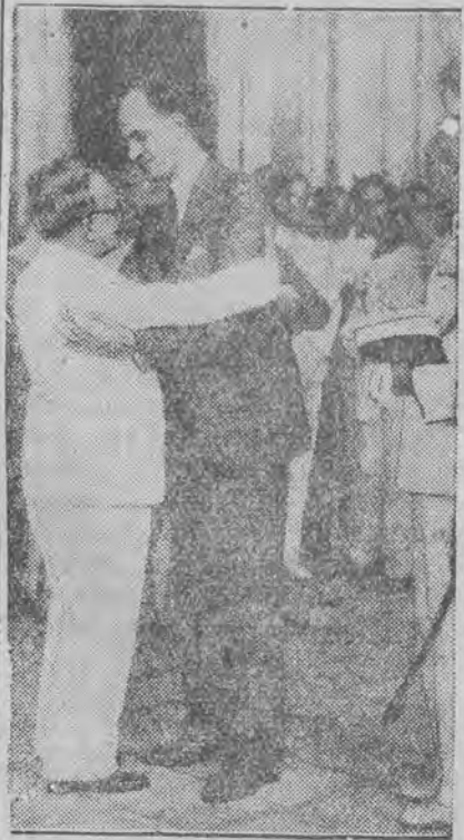
Nowoobрани prezydent Kuby, Cespedes, obejmuje posła amerykańskiego na dowód wdzięczności za zdecydowaną interwencję St. Zjednoczonych, która umożliwiła szybką likwidację rewolucji.