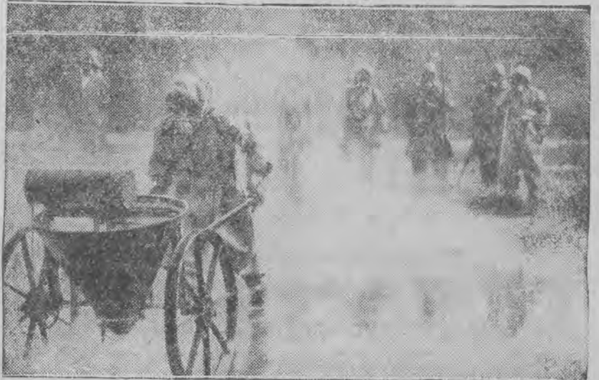
Członkowie kursu obrony przeciwlotniczej oczyszczają teren po ataku gazowym aeroplanów. Ulice są polewane wodą, potem posypywane chlorkiem wapna i zamiatane.