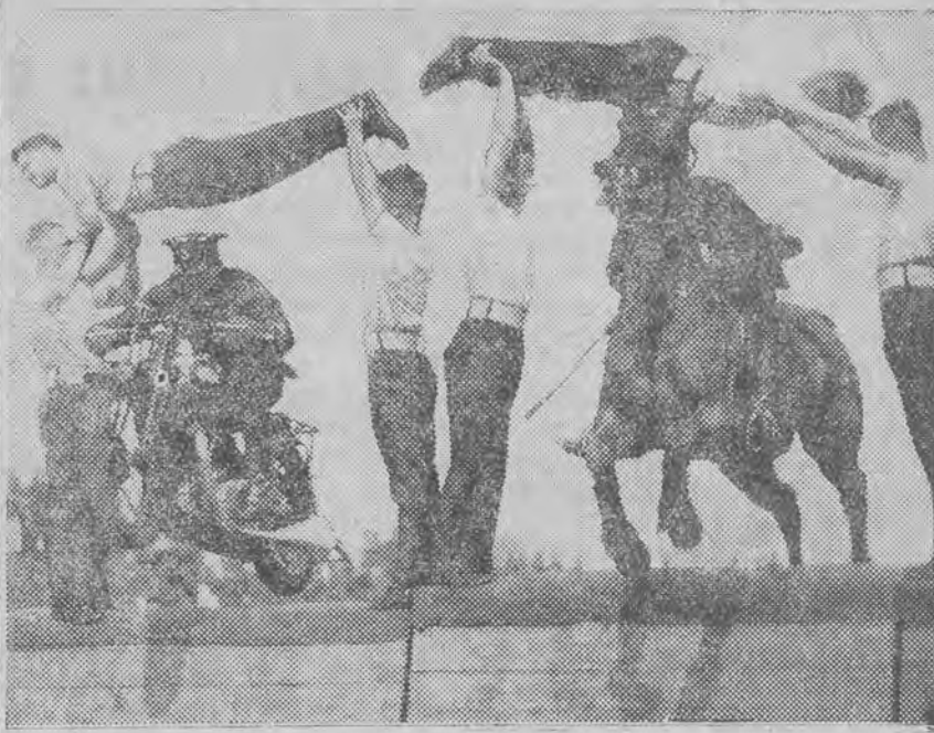
Mecz między motocyklem i koniem podczas manewrów angielskich.