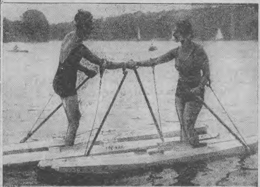
wita się na tafli spokojnego jeziora. Ten nowy sport zyskuje sobie coraz więcej zwolenników w Europie