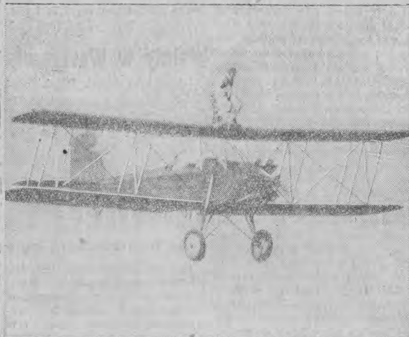
Podczas międzynarodowego meclingu lotniczego w Chicago jeden z uczestników popisywał się na skrzydle samolotu niezwykłymi sztuczkami akrobacyjnymi