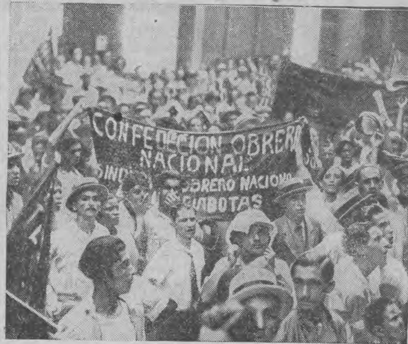
Masowe demonstracje komunistyczne przed ministerstwem oświaty w Havannie.

Odcinek powieściowy „Głosu Porannego” z d. 20.9 1933 r. Nr. 25