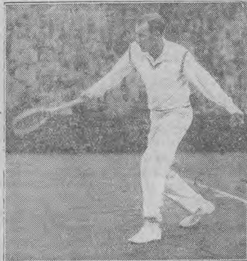
Na lewo: Hans Nüsslein (Niemcy). — Na prawo: William T. Tilden (Stany Zjednoczone).