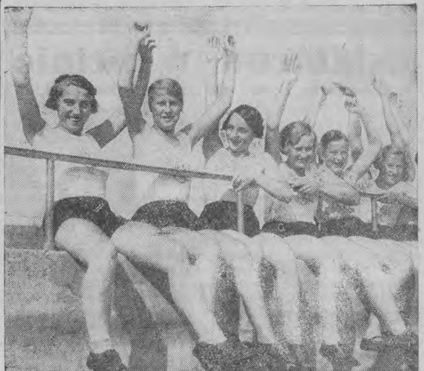
podczas meczu lekkoatletycznego w Zurychu.