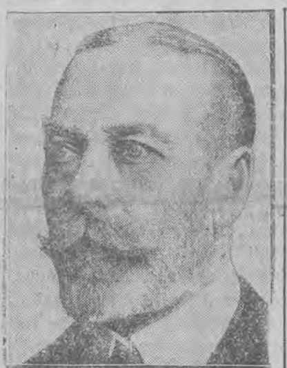
Król Jerzy V.

W końcu król nawiązał do zagadnień wewnętrznych, domagając się