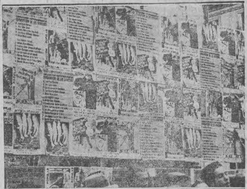
Niezwykły obraz madryckiej ulicy podczas wyborów do parlamentu