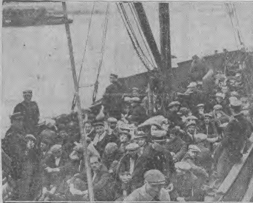
Sikazanczy francuscy transportowani na roboty przymusowe do Gwiany.