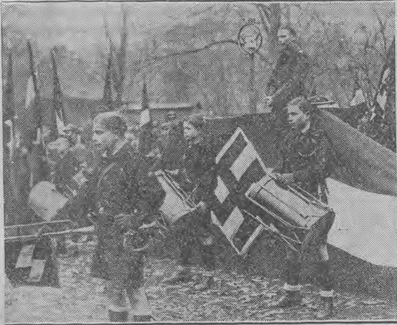
Wśród bicia w bębny i hucznych fanfar ogłupia się dzieci niemieckie i zatruwa się je jadem nienawiści.