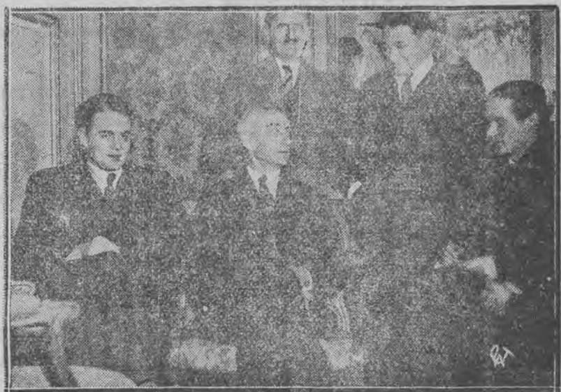
Laureat tegoroczny nagrody literackiej Nobla, pisarz rosyjski Iwan Bunin, udziela wywiadu prasie paryskiej.