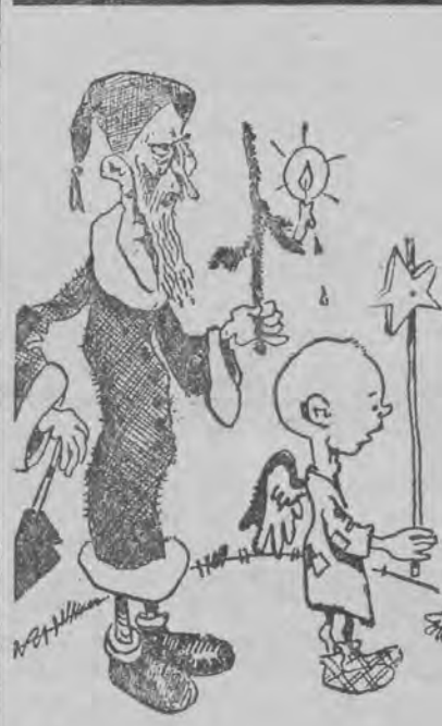
Kryzysowy święty Mikołaj.

Sprawę tę powinny władze szkolne wyjaśnić.