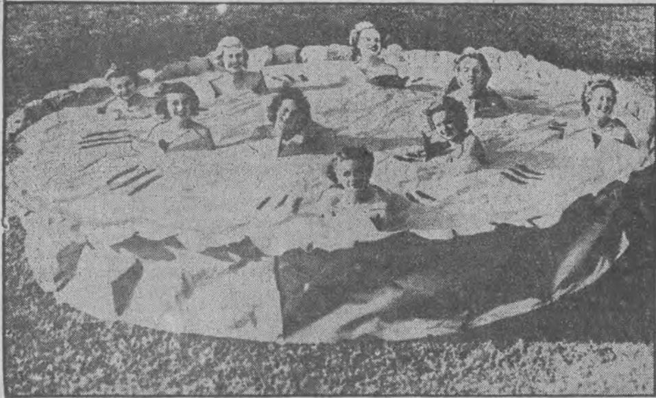
„Słodki torcik” z żywymi rodzynkami. Na jednym z balów dobroczynnych w Miami (Floryda) zaprodukowano dość niezwykły taniec: Z olbrzymiego tortu wylonily się nagle tancerki-syrenki.