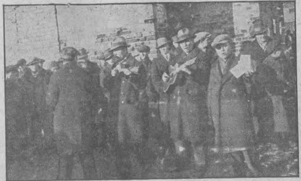
„Mała kobietko czy wiesz...”