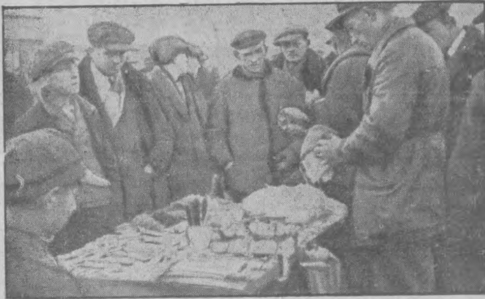
Maszynki i aparaty kuchenne do szatkowania jarzyn na różne wzory.

Amerykańskie bazary na ulicach Łodzi — Upstrzone targowisko — Kto i co sprzedaje — Rodzajowe obrazki — Psi targ — Łopisy ulicznych rewelersów — Pieśni bez słów