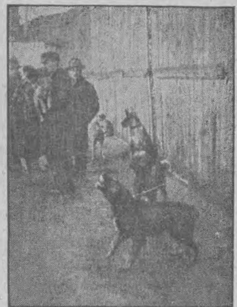
W oczekiwaniu na nowych panów.

to kot ot taki kotek sam mam kota mama ma 2 kotki mama ma 2 kotki