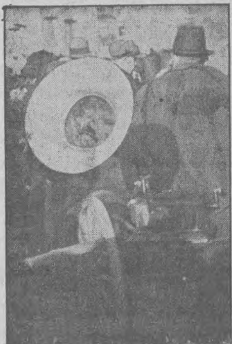
Antyk z osiemnastego wieku czeka na nabywcę.