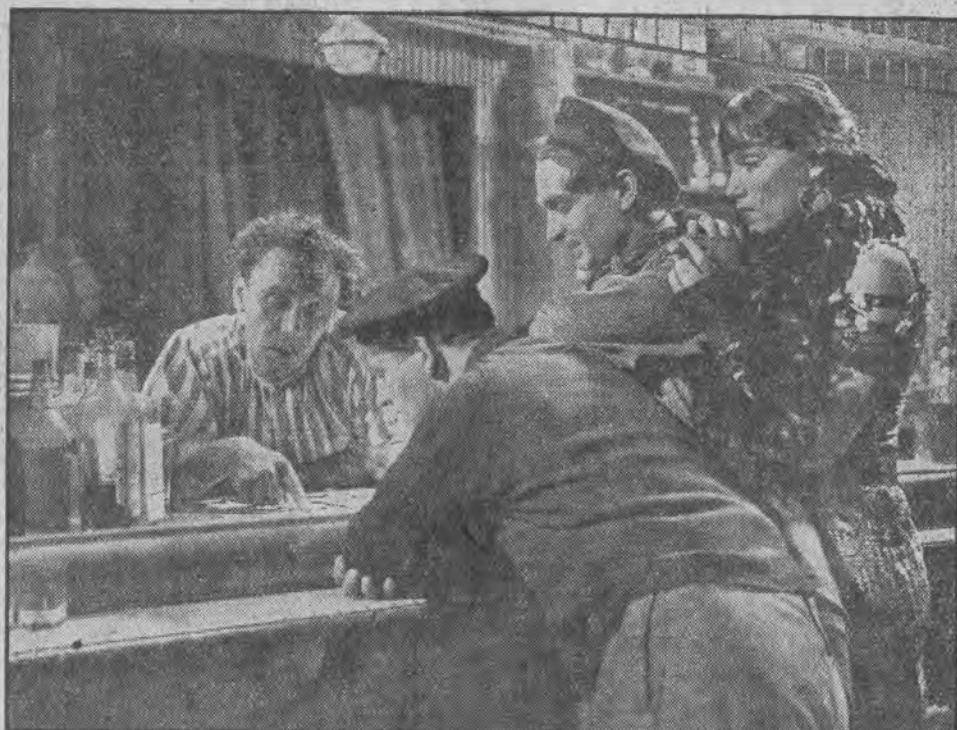
Djabeł w butelce.

Pisaliśmy dużo o dubbingowaniu filmów, to znaczy o podkładaniu polskiego tekstu pod obce filmy. Przykładem takiego dubbingu jest wyświetlany obecnie w Polsce obraz niemiecki „Siostra Maria jest szpiegiem“ z K. Veidtem w roli głównej.