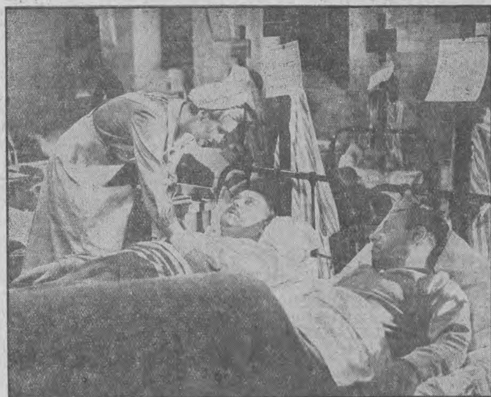
Pierwszy dubbing polski.

Baby Jane ze swym ulubionym miśkiem i malowanym wiaderkiem.