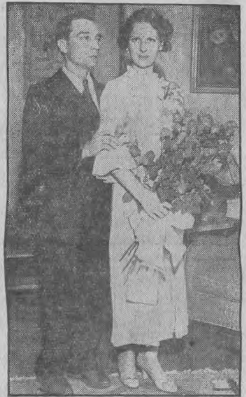
Keaton się ożenił.

W ostatnich dniach reżyser Wyler ukończył dla Universalu film p. t. „Mała czarodziejka”, w którym główne role odgrywają obok Margaret Sullavan, Herbert Marshall i Frank Morgan.