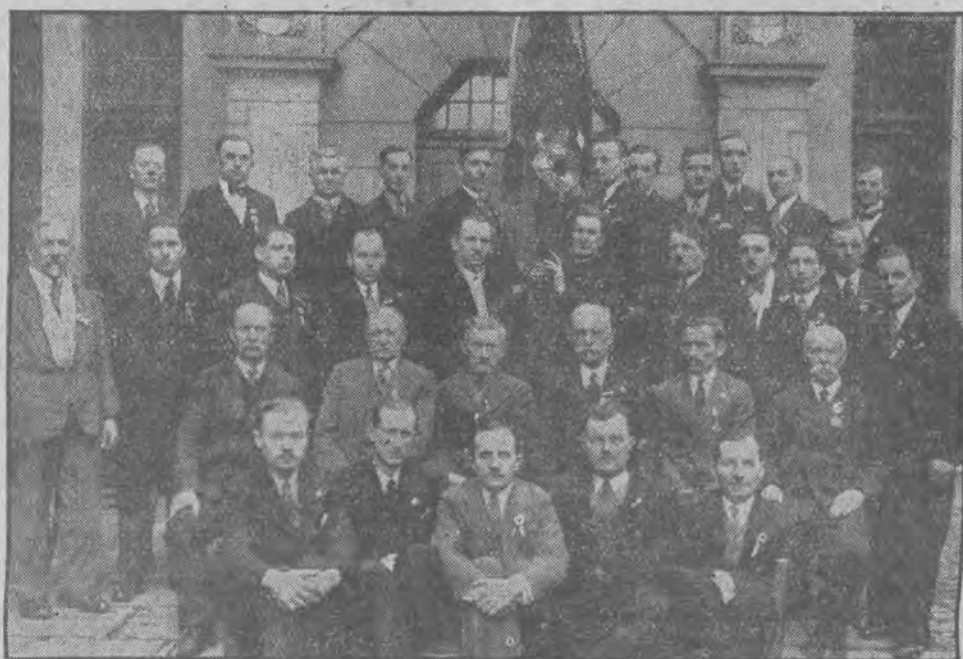
Grono jubilatów Stowarzyszenia Malarzy i Lakierników w Łodzi, którzy obchodzili swe 30-lecie pracy w Stowarzyszeniu.