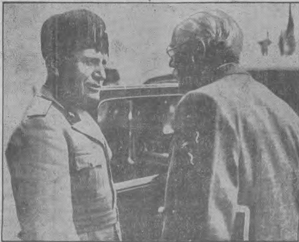
Z konferencji w Stresie: Benito Mussolini w rozmowie z premierem rządu angielskiego MacDonaldem. Stresa miała wczoraj nieładną sensację. Hitler bowiem zgłosił imieniem Niemiec przystąpienie do paktu wschodniego.