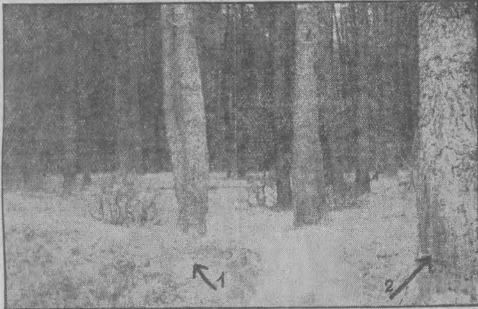
Miejsce w lesie rogowskim, gdzie został rozstrzelany Paweł (1). W miejscu oznaczonym (2) pochowano zwłoki nieśczęśliwej ofiary denuncjacji.