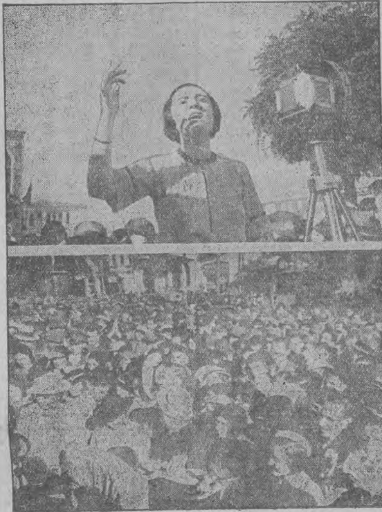
W Turcji odbywa się obecnie intensywna propaganda na rzecz powiększenia lotnictwa. M. in w Stambule zwołano wiec, na którym przemawiała córka jednego z ministrów, wzywając do ofiar pieniężnych na budowę 500 nowych samolotów wojen.