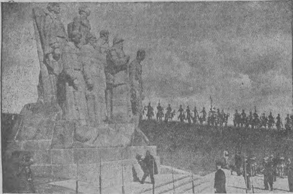
W miejscowości Oulchy-Breny, we Francji, odbyło się uroczyste odsłonięcie pomnika poległych w bitwie, która toczyła się od 15 lipca do 4 sierpnia r. 1918 na polach Oulchy. Na zdjęciu prezydent Lebrun składa wieniec u stóp monumentalnego pomnika, z prawej oddział kawalerji arabskiej oddaje honory.