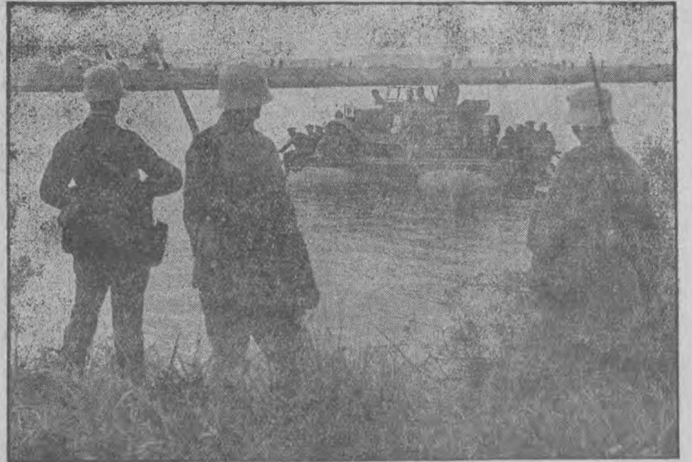
SZÓSTY PUŁK KONNICY NIEMIECKIEJ podczas odbywanych w tych dniach manewrów, przepłynął się przez Odrę, nie odwołując się do pomocy saperów. Na fotografii: przewożenie na promie, zbudowanym z gumowych łodzi, zmotoryzowanego działka, lekkiego kalibru.