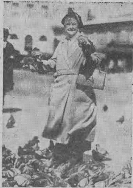
70-letnia gwiazda filmowa, Adela Sandrock, kiedyś słynna artystka sceniczna, dzisiaj ulubiona odtwórczyni groźnych ciotek i teściowych w filmach niemieckich, karmi gołębie na placu przed Feldherrnhalle w Monachium.

Opierając się na tym fakcie Rider Haggard, autor scenariusza filmu „Czarownica”