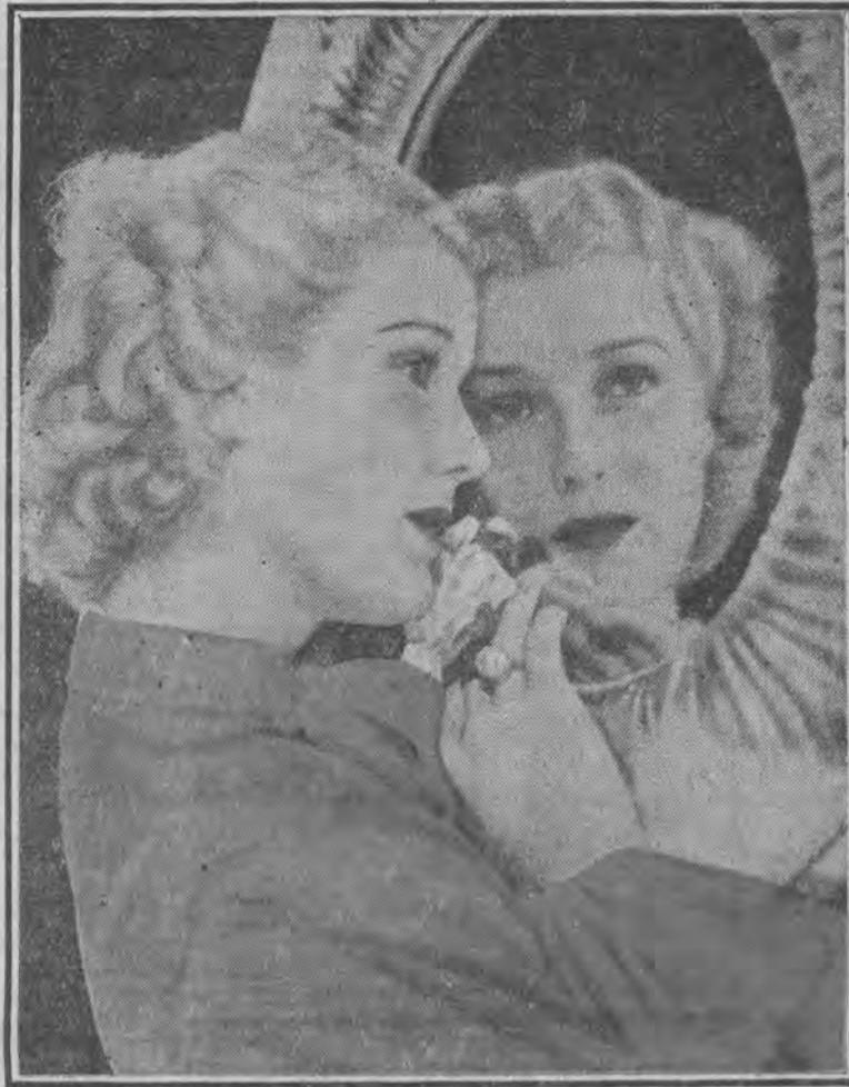
Tęskniące oczy ma młoda, urocza aktorka wytwórni Warner Bros., Anita Louise.

społeczną, nakładałby więzy artyście i hamował jego swobodę. Dlatego także jestem nieprzejednanym wrogiem wszelkiego rodzaju cenzury. Jest to poprostu impertynencja czynników oficjalnych, którzy mają niesłychany tupet ograniczać rozmach twórczy artysty. Sztuka jest znacznie donioślejszą rzeczą od polityki, i politycy nie mają prawa wtrącać się w dziedzinę sztuki.