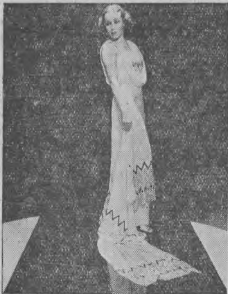
Dolores del Rio, niegasnąca gwiazda Hollywoodu, gra główną rolę w filmie „Kaliente, miasto miłości“. Fot. Warner Bros

Zainteresowałem się filmem do tego stopnia, że chciałem zobaczyć, jak pracuje Hollywood, stolica filmu. Poznałem już dokładnie pracę w wytwórniach angielskich, lecz moja znajomość filmu nie byłaby kompletna, gdybym nie był i w Hollywood także.