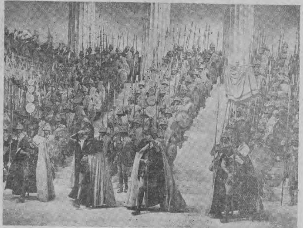
Amfitrion, oto tytuł antycznego filmu, którego akcja rozgrywa się w dawnej Grecji. Na zdjęciu scena z tego filmu: oddział hoplitów.