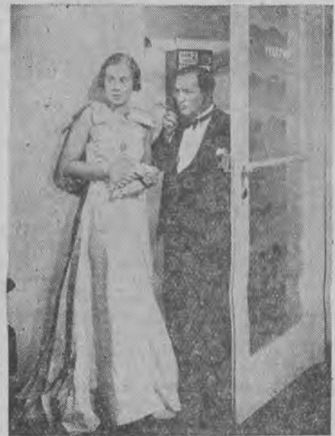
Ulubieniec Wiednia znany komik Hans Moser w nowej komedji pod tytułem „Moja mała“.

Interesuję się filmem dopiero od dwóch lat i już w przeciągu tak krótkiego czasu zauważyłem olbrzymi postęp. Nie przestaję twierdzić, że film stanie się najwyższą formą sztuki. Film ma znacznie szersze możliwości od sceny, lecz dobry scenarzysta jest jednak najważniejszy dla wartości filmu. Największy nacisk powinien być położony na wartość scenariusza. Jestem przeciwnikiem filmu kolorowego długometrażowego i uważam, że tylko dodatki rysunkowe powinny być nakręcane w kolorach. Uważam, że należy unikać filmowania sztuk teatralnych, które rzadko stanowią dobry materiał filmowy, natomiast zwrócić więcej uwagi na książki, w których jest nieprzebrane bogactwo materiału par excellence kinowego. Niektóre książki można przenieść na ekran niemal scena za sceną. Na zakończenie chciałbym zaznaczyć, że jestem wielkim entuzjastą filmu i że mam nadzieję poświęcić się niemal całkowicie dla kina.