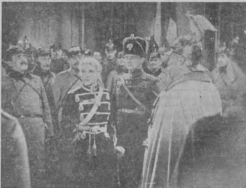
Drugą wersję Koenigsmarka nakręcono obecnie. Oto scena z tego obrazu.

Charles Laughton, jeden z najgenialniejszych aktorów filmowych ukaże się po raz pierwszy w roli komedjowej w kapitalnym filmie p. t. „Arcylokaj“. Film ten wyświetlany jest obecnie w Berlinie pod tytułem „Der „Musterdiener“ i cieszy się niebywałym powodzeniem. Prócz Laughtona udział bierze świetny zespół czołowych aktorów Ameryki, mianowicie: Mary Boland, Charles Ruggles, Zasu Pitts, Roland Young i Leila Hyams. Reżyserował Leo Mac Carev.