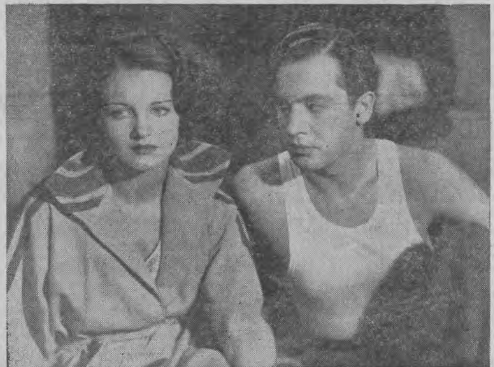
Na elektryczne krzesło...

Gary Cooper, który ostatnio ukończył film „Pokusa“ z Marleną Dietrich, przystąpił do nakręcania filmu o nieustalonym jeszcze tytule. Film ten reżyserować będzie King Vidor