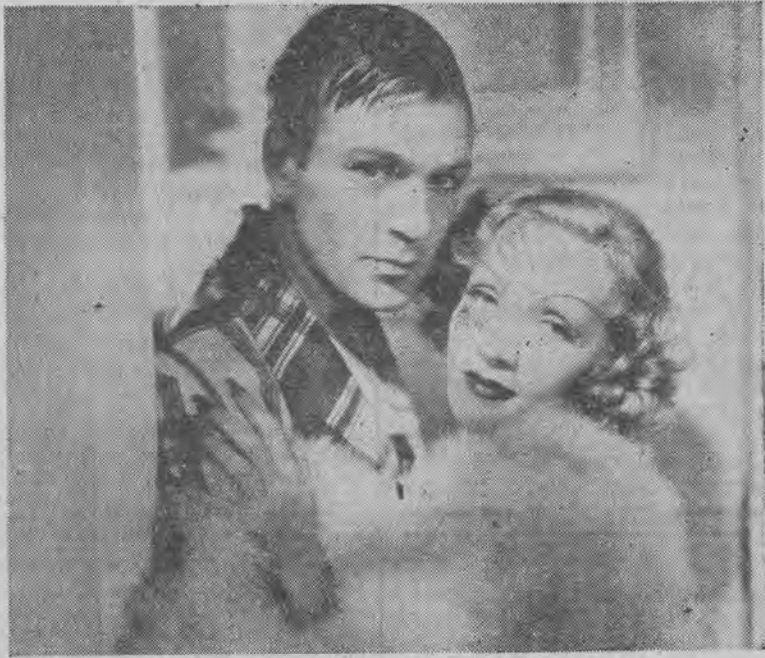
Awanturka w wielkim stylu

Państwo Chaplin śmieją się. Słynny Charlie Chaplin i jego żona Paulette Goddard, która gra obok swego męża główną rolę w ostatnim jego filmie „Dzisiejsze czasy“.