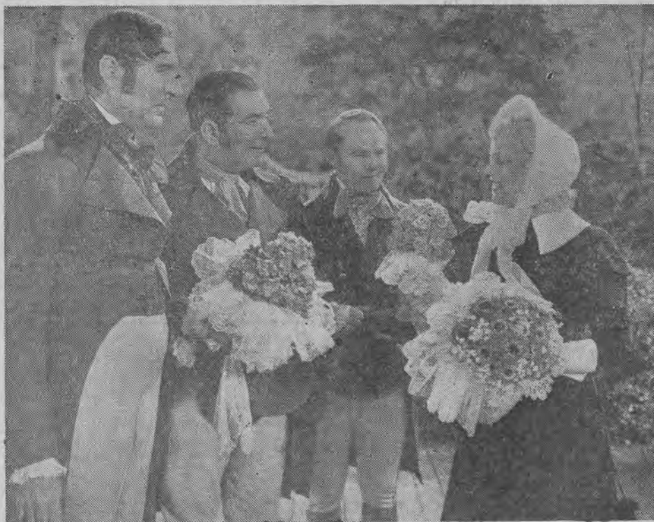
Którego z nich wybiorę?

Pewnemu architektowi angielskiemu Eugeniuszowi Mollo udało się wynaleźć sposób, w który można utrwalac powiększenie fotograficzne... na ścianie. Na zdjęciu widzimy obraz, który następnie trzeba utrwalic, spryskując go odpowiednią kapielą. Wynalazek ten znajdzie spewnością duże zastosowanie w zdobnictwie wnętrza.