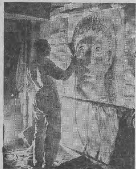
Fotografie utrwalone... na ścianie.

Partnerką Herberta Marshalla została młoda, utalentowana aktorka, Gertruda Michael, znana z filmów „Niebezpieczna piękność“ i „Ostatni posterunek“. Para ta ukaże się aż w dwóch filmach, a mianowicie: w dramacie szpiegowskim p. t. „Something to lib for“ oraz w filmie salonowym p. t. „Zapomniane twarze“.