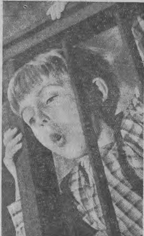
A tu widzimy jej francuskiego kolegę, Alain Michela w „tajemnicy poliszynela”.

Najsłynniejsza gwiazda filmu amerykańskiego, najbardziej „dochodowa” z gwiazd, Shirley Temple.