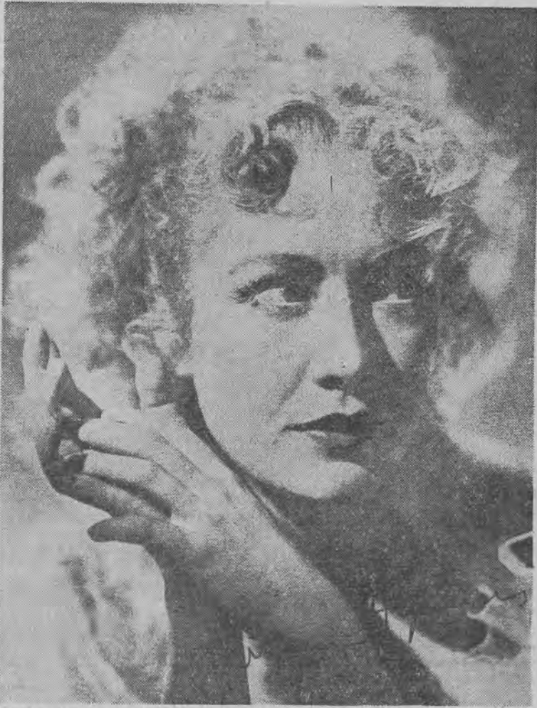
Znakomita tragiczka ekranu, mało ostatnio widywana we filmach artystyka Miriam Hopkins.

Reżyser Dave Butler nie zapomniał o cukrze dla swego, jak się wyraził najpункtualniejszego i napsłusznieszego aktora, okazując mu w ten sposób zadowolenie po zdjęciach.