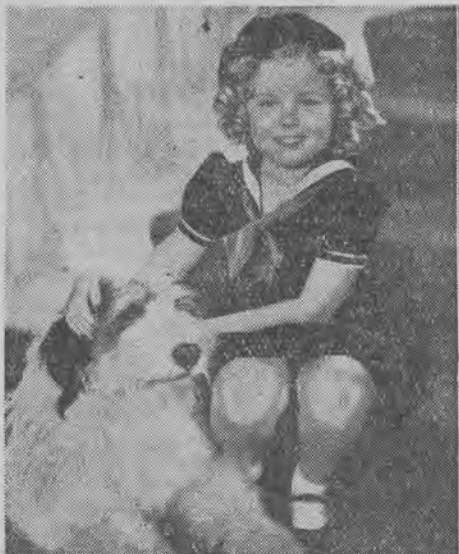
Szirllejka i naśladowcy.

Najsłynniejsza gwiazda filmu amerykańskiego, najbardziej „dochodowa” z gwiazd, Shirley Temple.