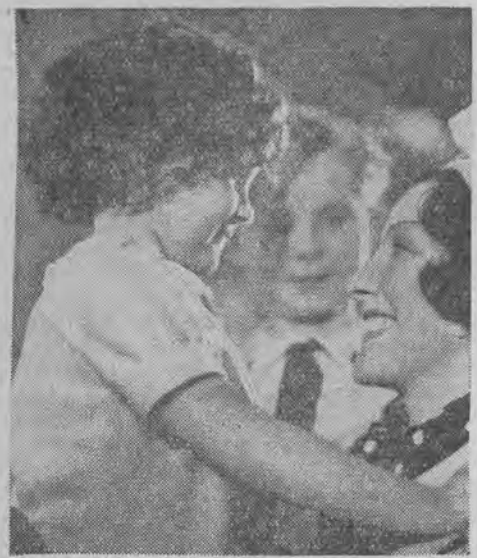
Ulubienicą francuskich dzieci jest malutka gwiazdeczka Mireille Colussi.

i Australji. Mała dziewczynka bije rekordy na polu popularności, zaćmiewając nawet największe gwiazdy Hollywoodu i najznakomitszych mężów stanu.