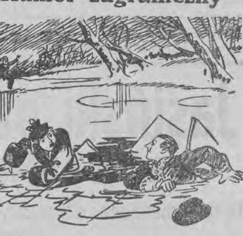
— Widzę, że muszę przerwać uczenie pani jeżdżenia po lodzie. Może pani chce, żebym ją nauczył pływania? (M) (The Happy Mag., Londyn).

Ogłoszenia 1-lamowy milimetr lub jego miejsce kosztuje w zwyczajnych na stronie 6-lamowej 15 groszy, na stronie redakcyjnej (4-lamowej): a) przy końcu części redakcyjnej 30 groszy, b) na stronie czwartej 50 groszy, c) na stronie drugiej 60 groszy, d) na stronie wiadomości miejscowych 1.— zł. Drobneogłoszenia (najwyżej 100 słów, w tym 5 nagłówkowych) słowo nagłówkowe drukiem tłustym, 15 groszy, każde dalsze słowo 10 groszy. Ogłoszenia większe wśród drobnych poczynając od ostatniej strony, 1-lamowy milimetr 30 groszy. Ogłoszenia skomplikowane, z zastrzeżeniem miejsca — od poszczególnego wypadku 20%, nadwyżki. Ogłoszenia do bieżącego wydania przyjmujemy do godziny 10.30, a do wydań niedzielnych i świątecznych do godziny 9.30 rano. Za błędy drukarskie, które nie zwiększają treści ogłoszenia, admimistracja nie odpowiada. Ogłoszenia przyjmujemy tylko za opłatą w góry.