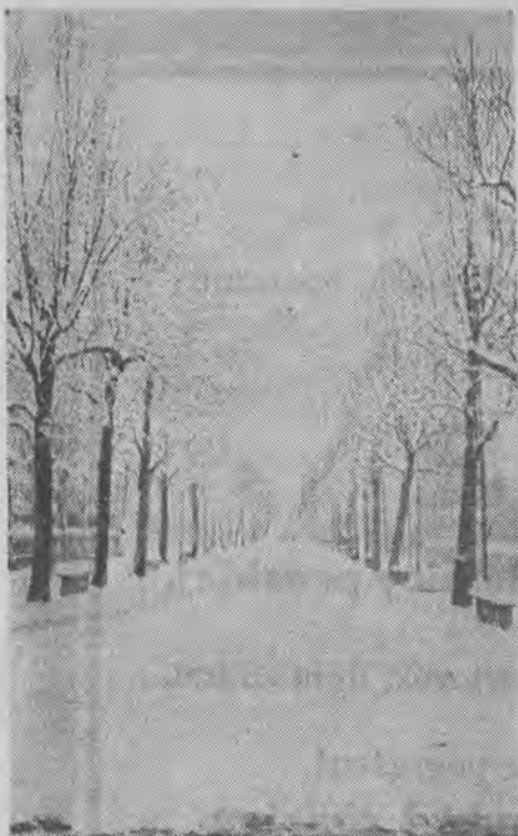
Pięknie wygląda w śnieżnej szacie aleja na pl. Dąbrowskiego