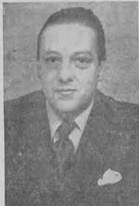
PRZEDSTAWICIEL NARODOWEJ HISZPANII

Ziemia Kaliska wyrównuje front z resztą Wielkopolski, z którą nierozdzielnie jest złączona.