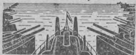
WPEŁY NA ŚCIGACZA ŁÓDZI I WOJ. ŁÓDZ. P.K.O. 42008