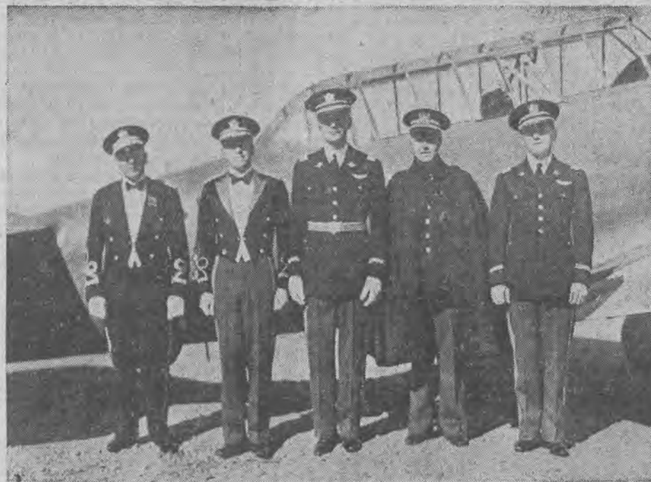
NOWE MUNDURY GALOWE LOTNIKÓW

Pińsk. (Kabel). Na terenie głównego ośrodka turystyki poleskiej, Pińska, prowadzone są ostatnio prace konserwatorskie celem zabezpieczenia zabytków tej ziemi. Szczególną uwagę zwracają prace nad konserwacją starodawnej rezydencji ks. Wiśniowieckich, zamku, wzniesionego przez ostatniego przedstawiciela tego rodu, wielkiego hetmana litewskiego, ks. Michała Serwacego. Ruiny zamku czynią obecnie nader przykre wrażenie, otoczone nędznymi domkami żydowskimi. Ruchliwe pińskie tow. upiększania miasta postanowiło wykupić wszystkie nieruchomości w bezpośrednim sąsiedztwie zamku zburzyć ohydne budy i stworzyć odpowiednie tło.