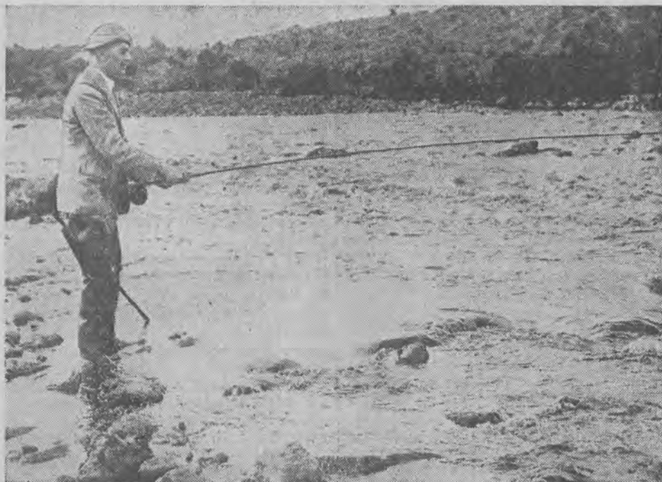
PREMIER ANGLII NA ŁOWACH

Premier angielski Chamberlain w chwilach wolnych od zajęć uprawia z zamiłowaniem rybolowstwo