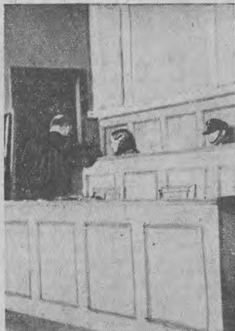
Zajdlowa rozmawia w czasie przerwy ze swym obrońcą.