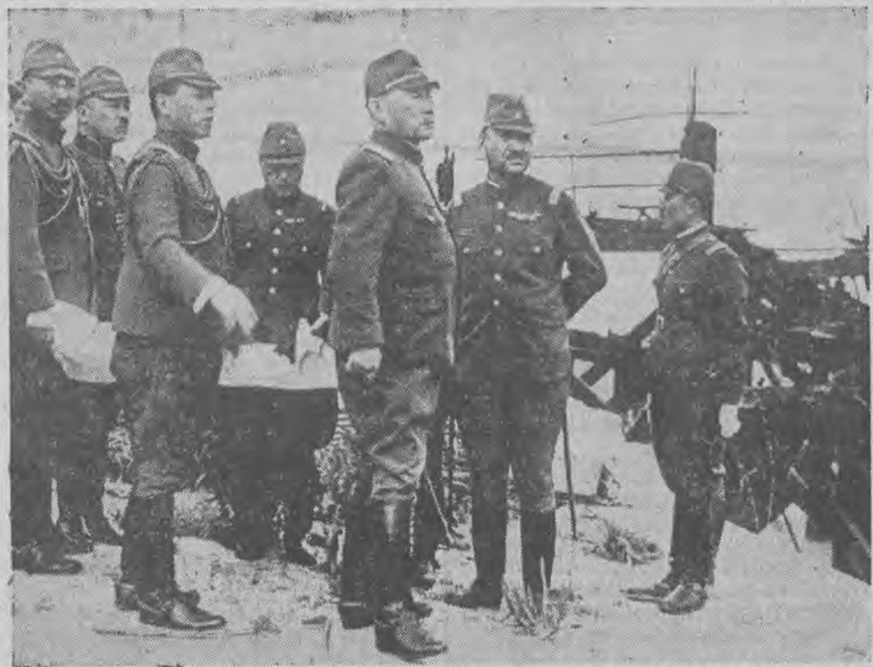
JAPONSKI MINISTER WOJNY W SZANGHAJU Gen. Sugiyama, min. wojny Japonii, odbywa inspekcję frontu północnego w Chinach. Na zdjęciu minister (trzeci od prawej) w [forcie Woosung

W kwadracikach umieścić pionowo 12 słów trzyliterowych. Litery środkowe są dla każdej pary słów wspólne. Znaczenie słów: 1) żartuje, 2) używa smu, 3) kędzior, 4) wał dusiciel, 5) lać, 6) głos w śpiewie, 7) owad, 8) skrót o znaczeniu Stany Zjednoczone Ameryki, 9) część sztuki teatralnej, 10) kraźki tłuszcza na rosale, 11) nazwa oznaczająca dawniejszych monarchów rosyjskich, 12) słup.