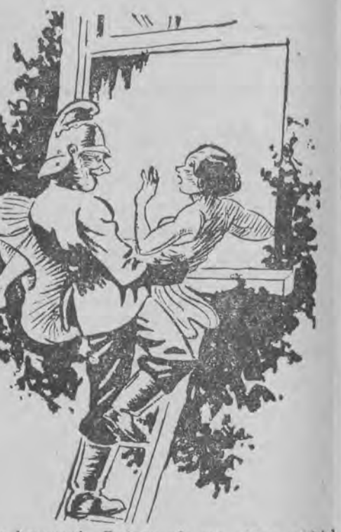
— Proszę nie krzyczeć. Pożaru nie ma. Nasz oddział przeprowadza jedynie ćwiczenia praktyczne. (M) („Sydney Bulletin”, Sydney).

Ogłoszenia 1-lamowy milimetr lub jego miejsca redakcyjnej 30 groszy, b) na stronie czerwonej 50 groszy, c) na stronie drugiej 60 groszy, d) na stronie wiadomości lokalnych 1,— zł. Drobne ogłoszenia (najwyżej 100 słów, w tym 5 nagłówkowych) słowo nagłówkowe drukiem tłustym, 15 groszy, każde dalsze słowo 10 groszy. Ogłoszenia większe wśród drobnych poczynając od ostatniej strony, 1-lamowy milimetr 30 groszy. Ogłoszenia skomplikowane, z zastrzeżeniem miejsca — od poszczególnego wypadku 20% nadwyżki. Ogłoszenia do bieżącego wydania przyjmujemy do godziny 10,30, a do wydań niedzielnych i świątecznych do godziny 9,30 rano. Ogłoszenia z poza Wielkopolski przyjmujemy do wydań bieżących do godz. 10, do wydań niedzielnych i świątecznych dnia poprzedniego do godz. 8. Za błędy drukarskie, które nie zniekształcają treści ogłoszenia, administracja nie odpowiada. Ogłoszenia przyjmujemy tylko za opłatą gotówką z góry. Konto w P. K. O. nr 200 149. Pocztove konto rozrachunkowe Poznań 3, nr kartoteki 03.