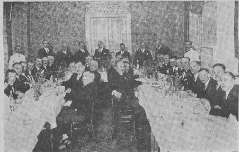
W związku z uchwaleniem nowej ustawy o ustroju adwokatury, w dniach 7 i 8. bm. obradował w Łodzi zarząd główny Związku Adwokatów Polskich. Przedstawiciele palestry polskiej z całego kraju przyjmowali oddział łódzki Związku. Na zdjęciu moment z wspólną kolacją w sali Stowarzyszenia Techników.