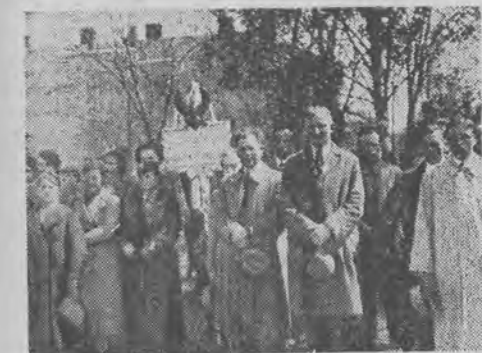
Władze Str. Nar., N. O. K. i „Pracy Polskiej” przyjmują defiladę oddziałów narodowych w dniu 3 maja w Ostrowcu.