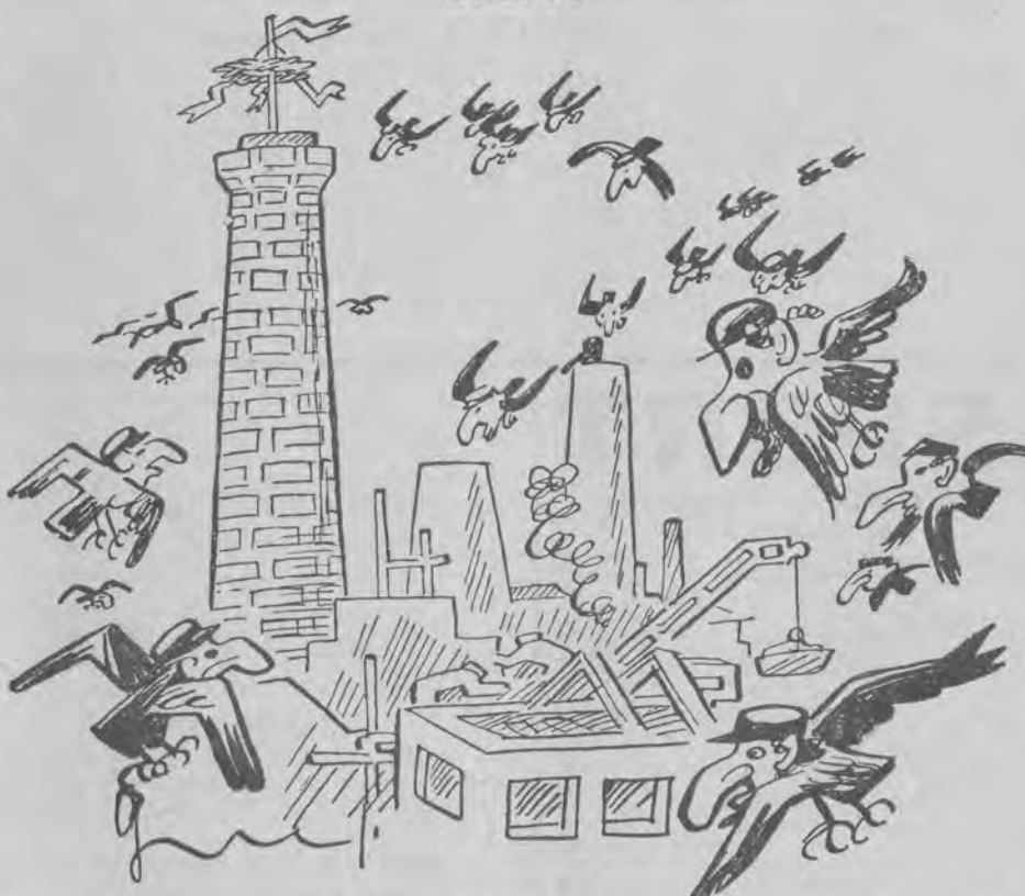
Żydowskie kruki zwietrzyły nowe żerowisko. Póki czas — postawić strachy!