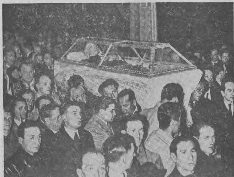
W pogrzebie b. premiera rumuńskiego Gogi wzięły udział olbrzymie tłumy ludności. Na zdjęciu przyjaciele Gogi niosą trumnę na cmentarzu