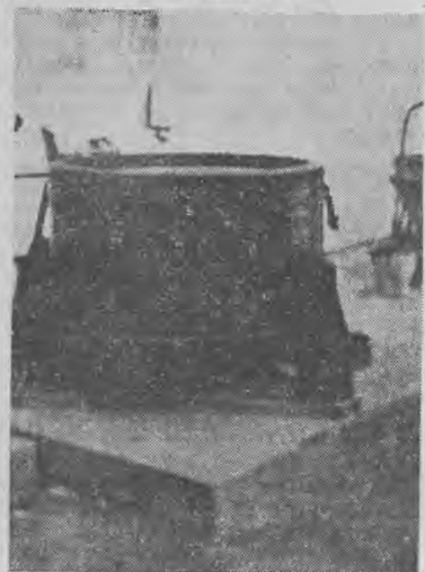
Fragment wnętrza fabryki

Jeszcze jeden moment decydującego znaczenia należy podkreślić. Czynniki kierownicze powinny wszystko zrobić, aby powstający w Polsce przemysł, produkujący sztuczną wełnę, miał charakter jak najbardziej polski. Obcy element należy usunąć od nowej gałęzi wytwórczości. (W)