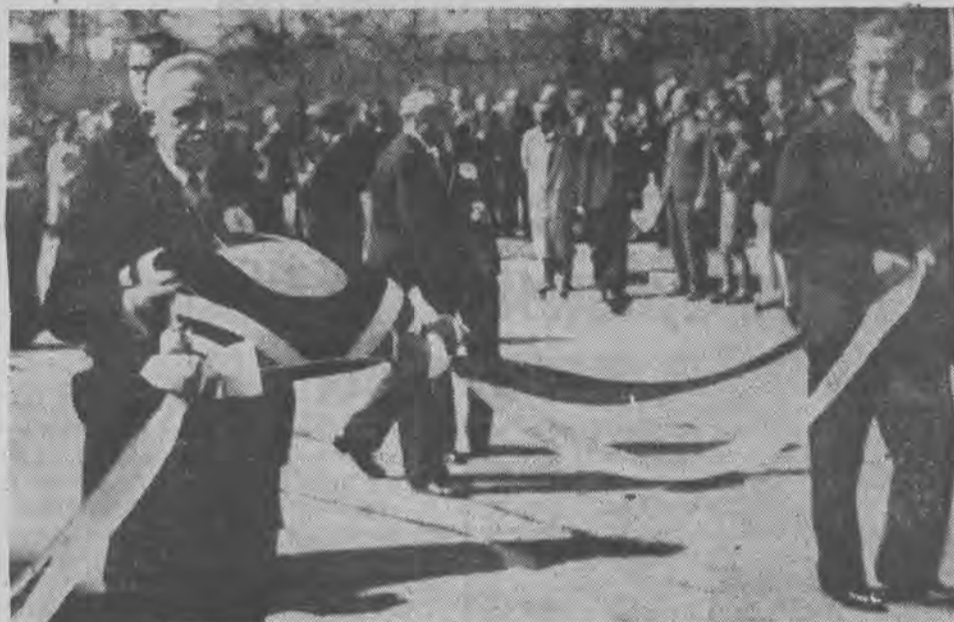
Jak już donosiliśmy, ogólnopolska pielgrzymka Kupiecka złożyła w niedzielę ub. na Jasnej Górze wotum. Na zdjęciu — czoło pochodu kupieckiego. Na poduszce niesiono wotum.