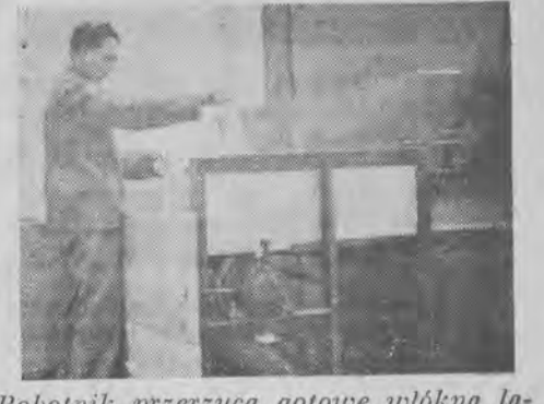
Robotnik przerzuca gotowe włókna la-nitalu (z fabryki wełny syntetycznej „Polana”).