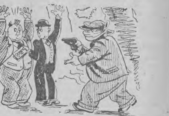
— Tutaj są dwie setki, które byłem ci winien. (M) („Berliner Illustrierte”, Berlin).

Ogłoszenia 1-lamowy milimetr lub jego miejsce kosztuje: w zwyczajnych na stronie 6-lamowej 15 groszy, na stronie redakcyjnej (4-lamowej) a) przy końcu części redakcyjnej 30 groszy, b) na stronie czwartej 50 groszy, c) na stronie drugiej 60 groszy, d) na stronie wiadomości lokalnych 1.— zł. Drobne ogłoszenia (najwyżej 100 słów, w tym 5 nagłówkowych) słowo nagłówkowe drukiem tustym, 15 groszy, każde dalsze słowo 10 groszy. Ogłoszenia większe niż drobnych poczynając od ostatniej strony, 1-lamowy milimetr 30 groszy. Ogłoszenia skomplikowane, z zastrzeżeniem miejsca — od poszczególnego wypadku 20% nadwyżki. Ogłoszenia do bieżącego wydania przyjmujemy do godziny 10,30, a do wydań niedzielnych i świątecznych do godziny 9,30 rano. Ogłoszenia z poza Wielkopolski przyjmujemy do wydań bieżących do godz. 10, do wydań niedzielnych i świątecznych dnia poprzedniego do godz. 8. Za błędy drukarskie, które nie zniekształcają treści ogłoszenia, administracja nie odpowiada. Ogłoszenia przyjmujemy tylko za opłatą gotówką z góry. Konto w P. K. O. nr 200-149. Pocztove konto rozrachunkowe Poznań 3, nr kartoteki 03.