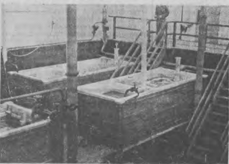
Fragment z fabryki lanitalu „Polana”. Kadzie z płynem, który służy do rozpuszczania kazeiny