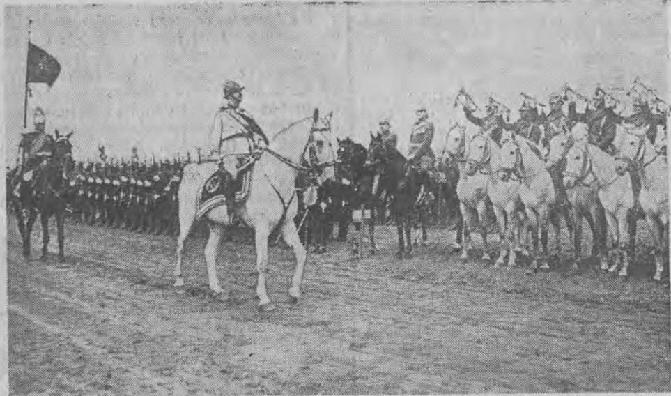
WIELKA PARADA ARMII RUMUŃSKIEJ

Jak już donosiliśmy w Pabianicach została otwarta pierwsza w Polsce fabryka wełny syntetycznej tzw. lanitalu, pod nazwą „Polana”. Na zdjęciu główna hala fabryczna