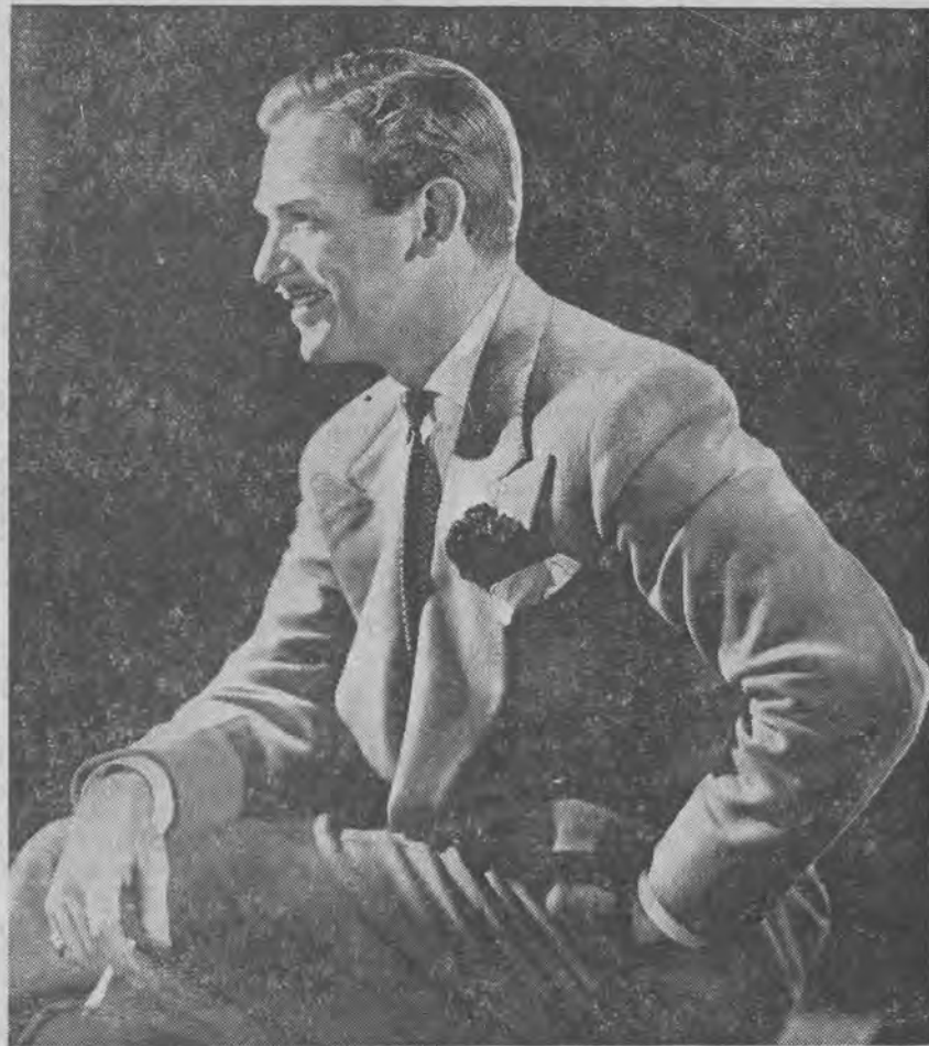
Douglas Fairbanks jr.

Są to wszystko zapowiedzi Hollywoodu, a że „Kobieta, którą kocham” wchodzi obecnie na ekrany polskie, będziemy mieli okazję do skontrolowania, czy zapowiedzi te są tylko reklama.