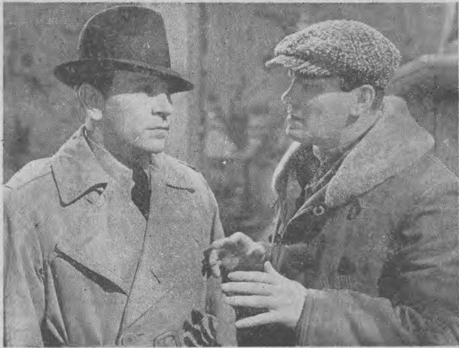
Spotkali się dwaj rywale

Cecil B. de Mille rozpoczął dla „Paramountu” produkcję filmu „Pacyfic”, w którym role główne kreują: Barbara Stanwyck i Joel Mc Crea.