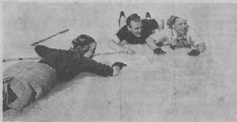
Wesołą zabawę w śniegu

Obecnie dopiero będzie ona miała możliwość, zważywszy na charakter filmu, wykazania swych znakomych wartości wokalnych. We filmie „Zaza” odśpiewa ona kilka piosenek, do których muzykę napisali czołowi kompozytorzy europejscy i amerykańscy.