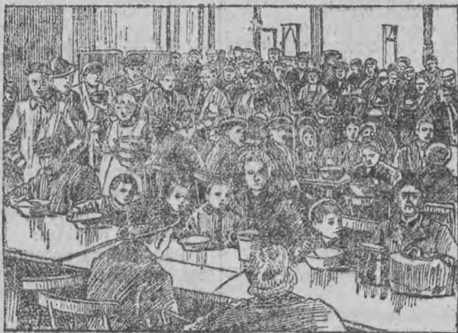
Dzieci i starcy otrzymują pożywienie w zakładach dobroczynności.