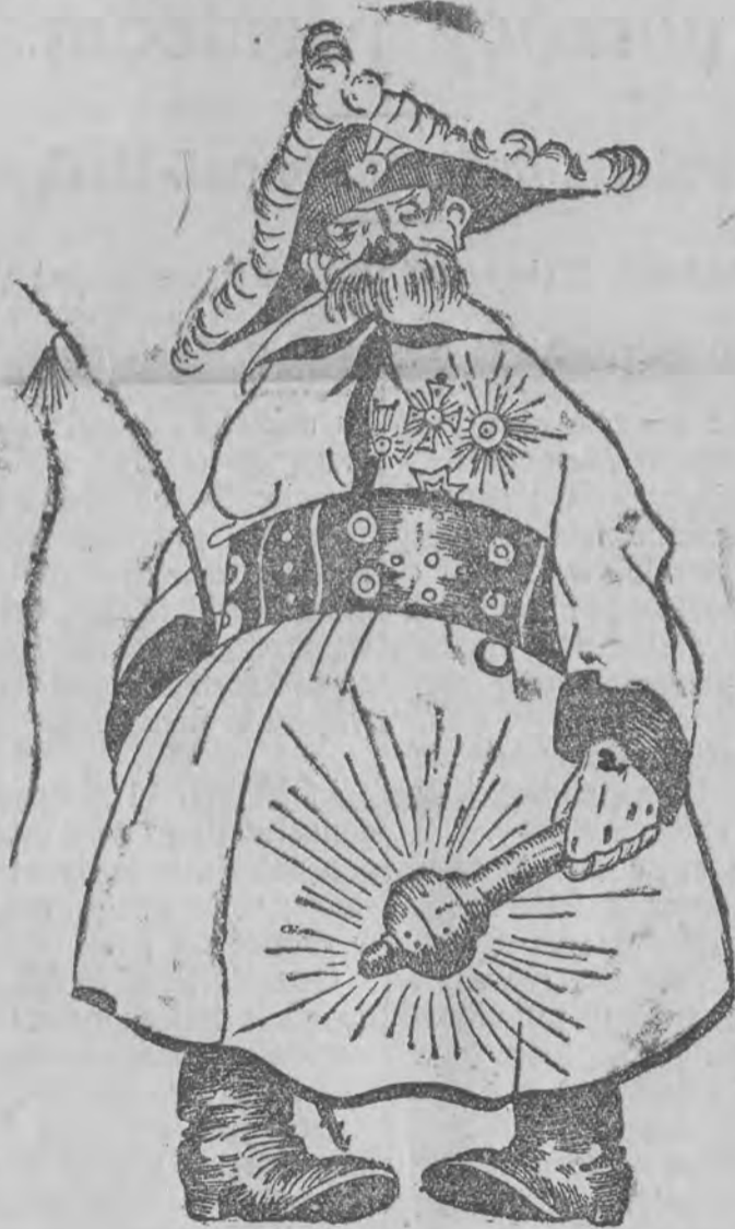
Rys. T. Kleczyński.