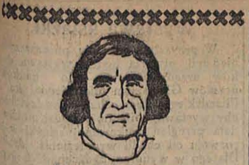
Z miłości ku cygance