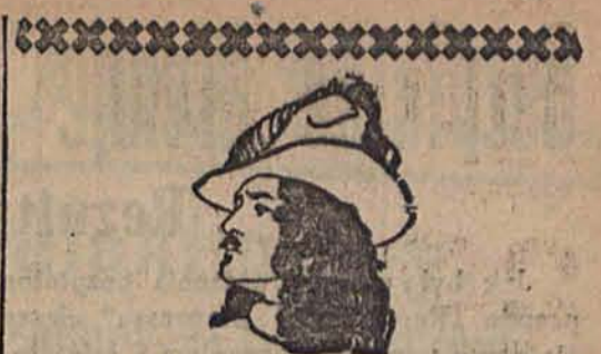
Z miłości ku cygance

Wyciąć i wrzucić w zamkniętej kopercie wraz z kuponem dzisiejszej „Republiki“ do skrzynki przy ul. Piotrkowskiej 49 w podwórzu.