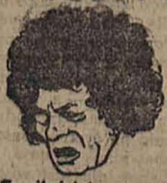
Z miłości ku cygance