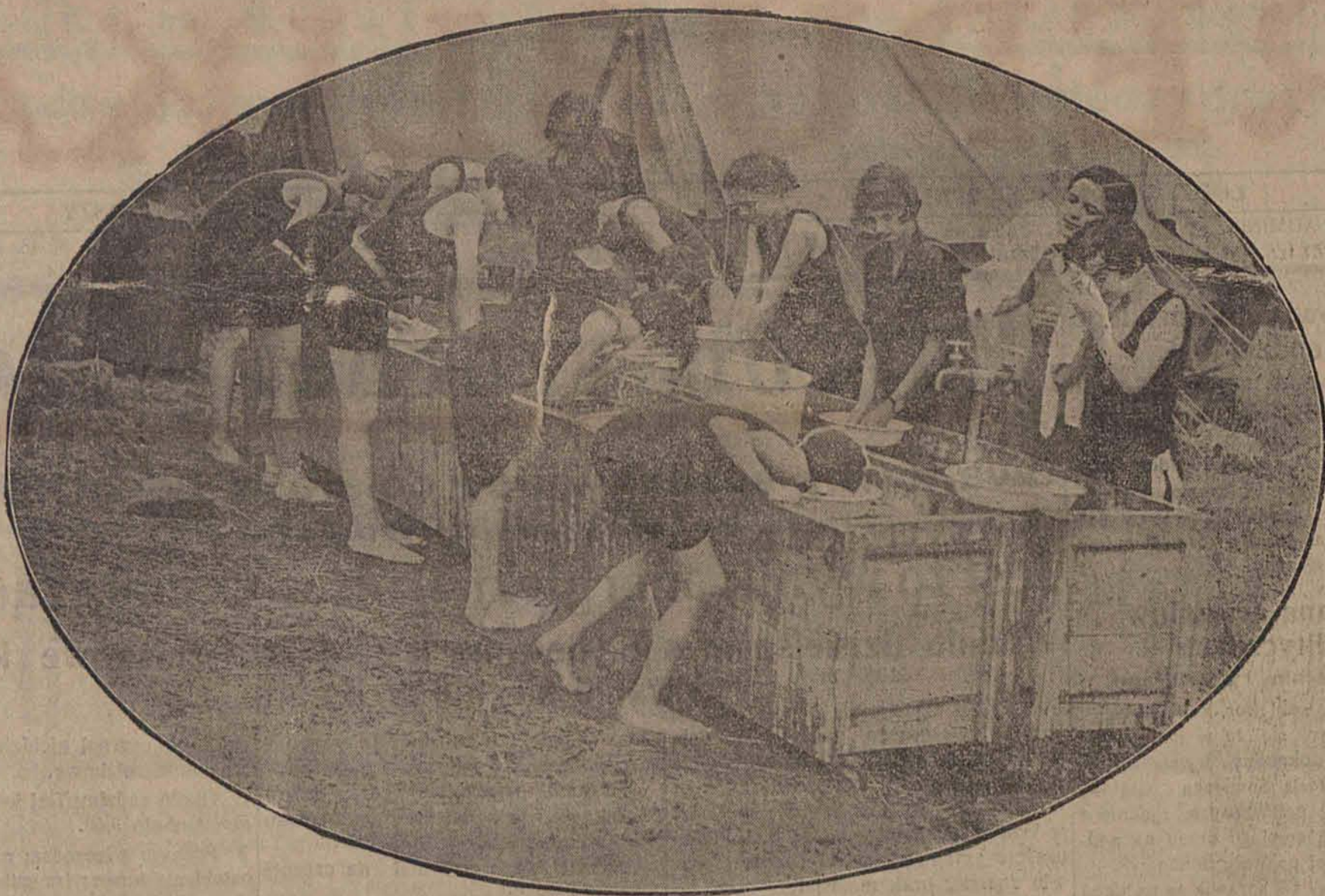
Angielki hartują się od młodych lat... W internatach angielskich uczennice robią ranną toaletę na świeżym powietrzu w specjalnych umywalniach... W Anglii rzadko kto „łapie“ katar.