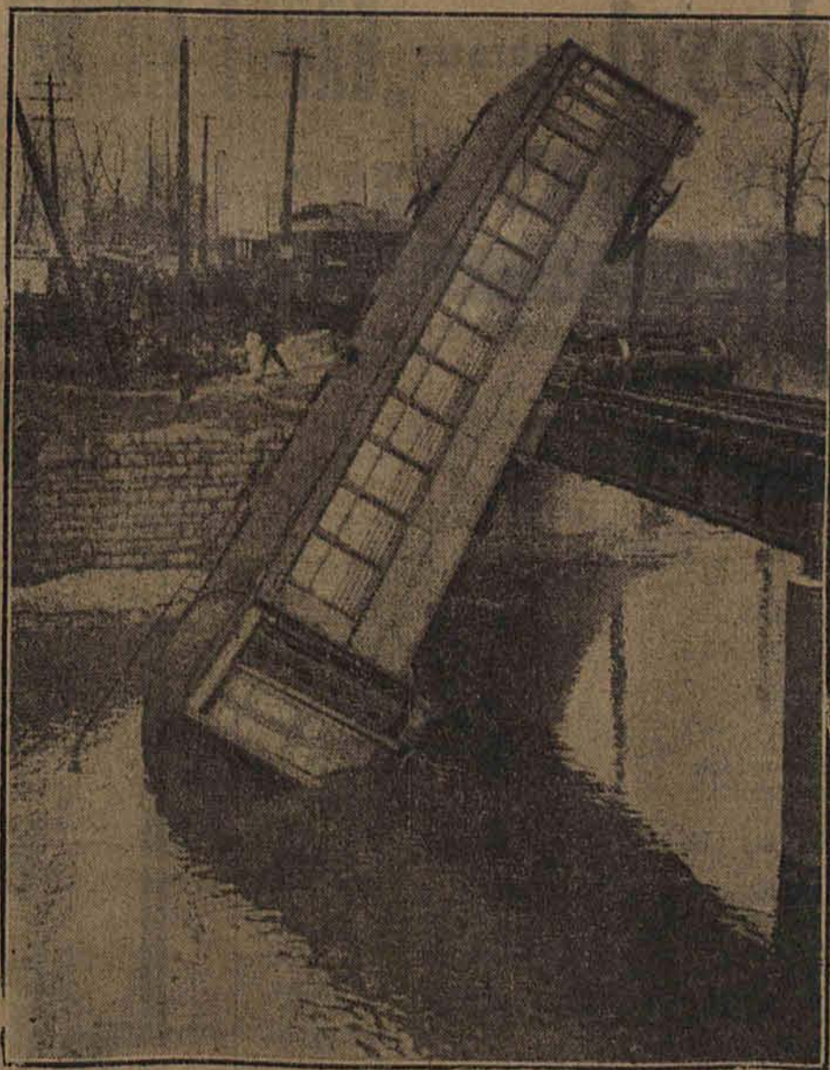
W Chicago tramwaj elektryczny wyskoczył z szyn na moście i zawisł w dziwnej pozycji nad przepaścią.

Jak się dowiadujemy obrońca skazańca podał telegraficzną prośbę o ulaskawienie na imię prez. Wojciechowskiego. As.