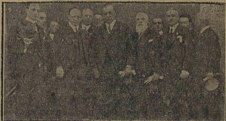
Ambasador sowiecki przy Kwirynale w otoczeniu dygnitarzy włoskich.

Okręt włoski „Ansaldo San Giorgio” utracił ster wskutek nadzwyczaj silnego prądu, Burza pędziła go po wodach 80 mil angielskich. Amerykański okręt policyjny napróżno starał się przytrzymać statek włoski i uratować podróżnych. Wysiłki te jednak niezupełnie się powiodły. Położone na wybrzeżu hotele ucierpiały bardzo silnie. Utonęło na wybrzeżu 8 rybaków. Dwa jachty, na pokładzie których znajdowało się 35 osób zaginęły bez śladu. W samym Miami szkody wyrządzone przez orkan obliczają na 100 tys. dolarów, szkody zaś na całym wybrzeżu na 5 milj. dolarów.