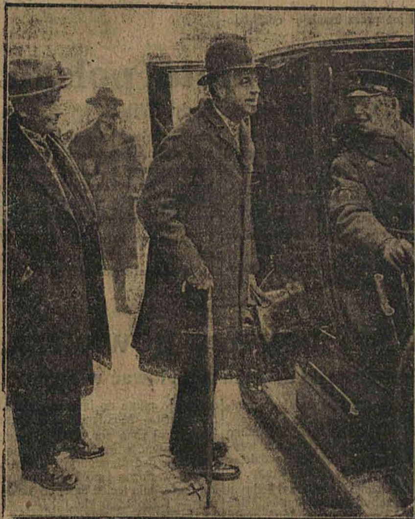
Erick Drumond, sekretarz generalny Ligi narodów.