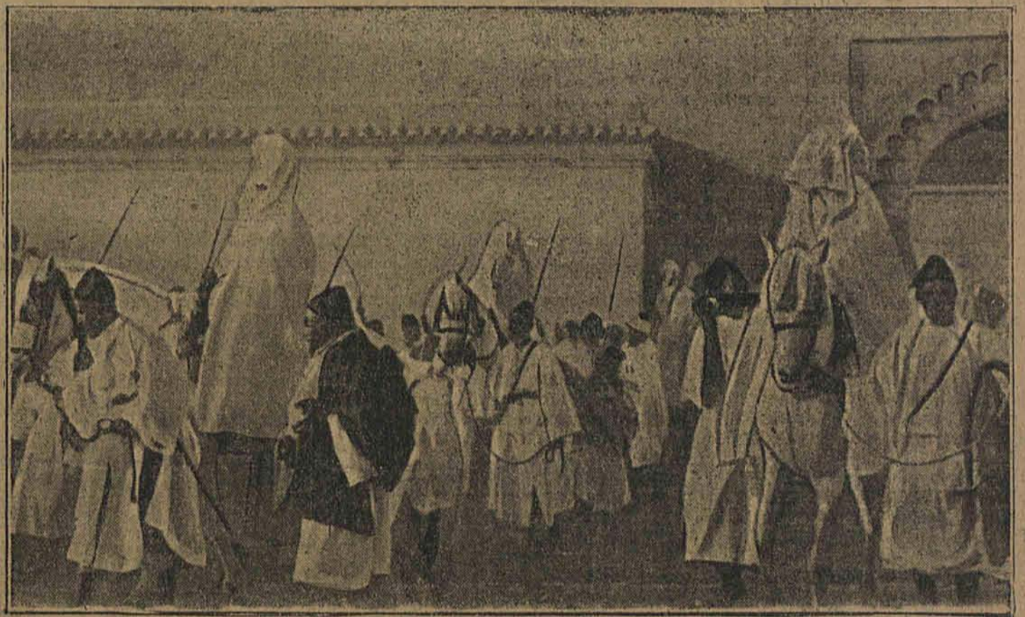
Sułtan marokański urządził jednocześnie — podobno ze względów oszczędnościowych — wesela swoim trzem synom. Na zdjęciu widzimy delegację plemion marokańskich, wiozące podarunki ślubne.

Drobne, ścisłe do czaski przylegające ucho mają ludzie wstydliwi, bojaźliwi.