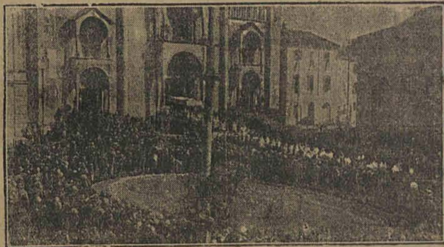
Kongres eucharystyczny, który się odbył w Piacenzy (Włochy).

Uchwały zebrania plantatorów zakomunikowane zostały wczoraj p. wicepremierowi Bartłowi. Rokowania z rządem trwają, wobec czego plantatorzy postanowili uchwał swych nie ogłaszać.