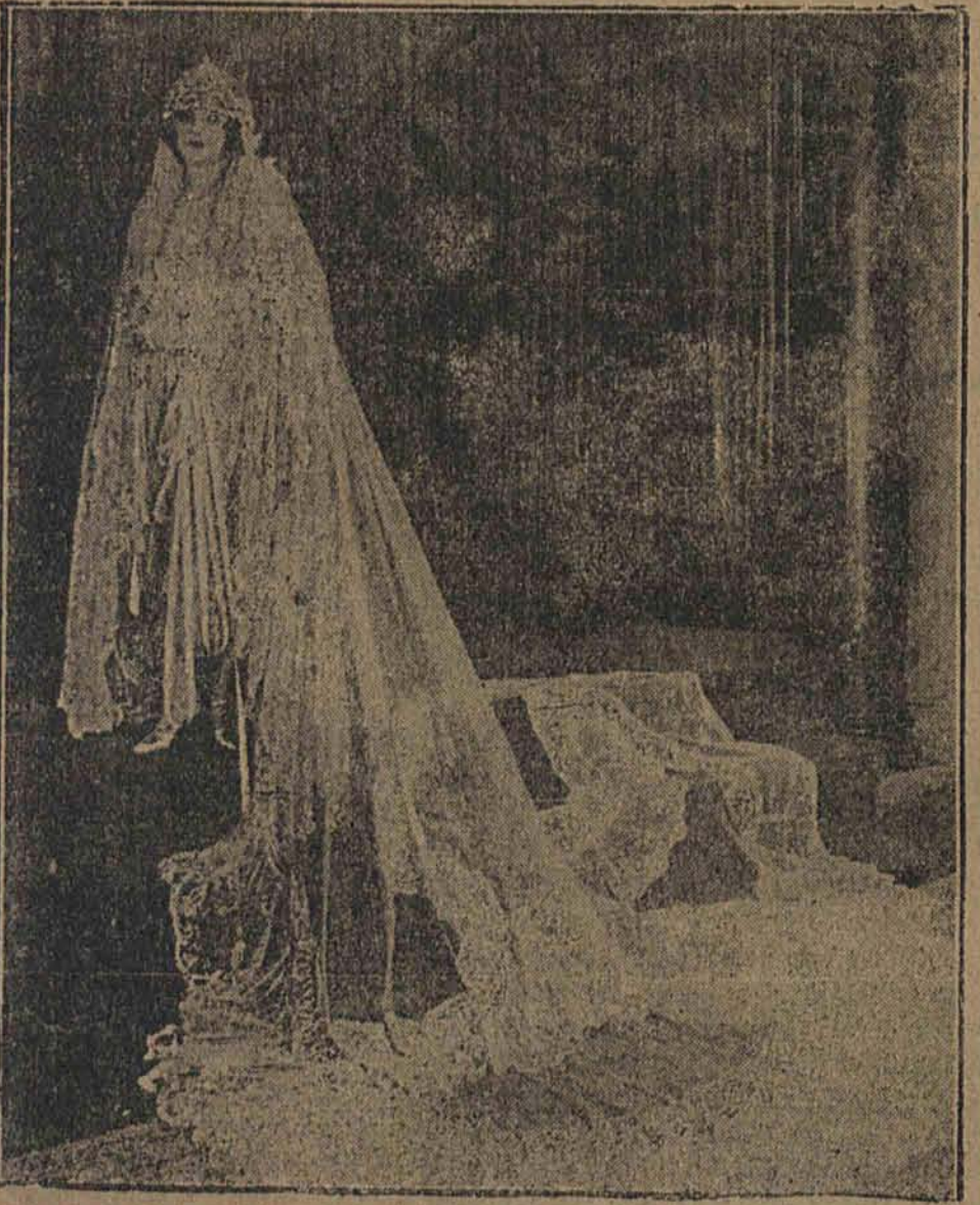
Wolon słubny miliarderek amerykański o wartości 10 tysięcy dolarów.

Wobec tego jest pewne, że organizatorzy ucieczki użyli pierwszego lepszego numeru i umieścili go na dwu samochodach. Miało to na celu utrudnienie pościgu, a tem samem — schwytańa zbiegów.