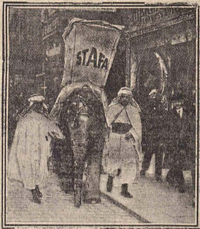
Pomysłowa reklama wiedeńska: Słoń obnosi po ulicach Wiednia reklamę domu towarowego „Stafa”.