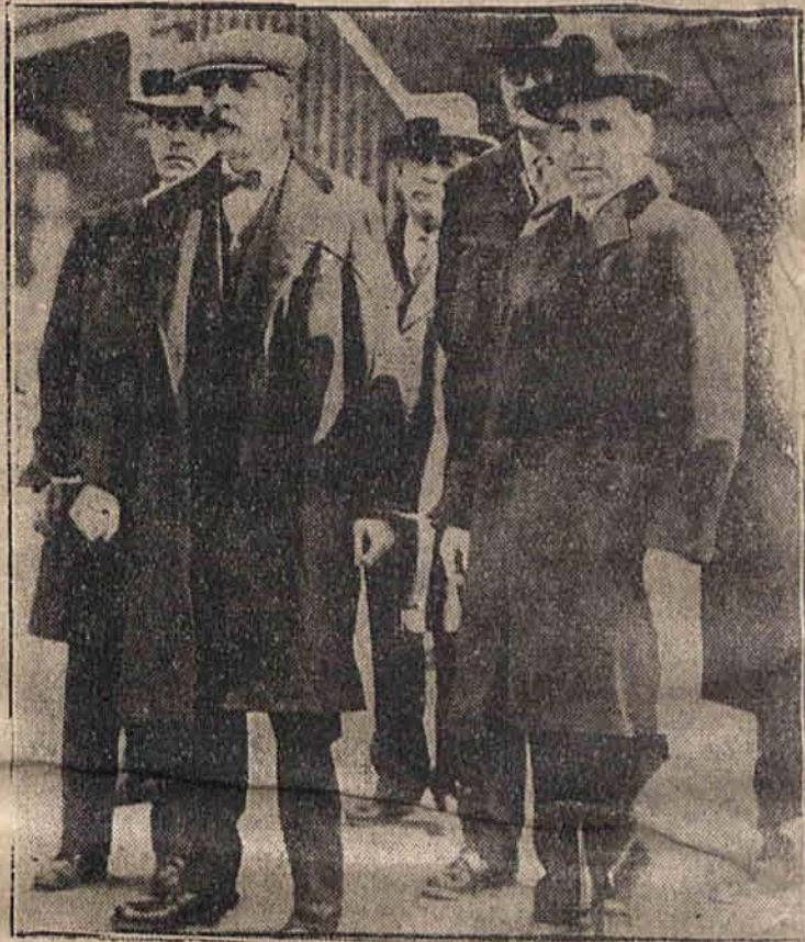
Sacco i Vanzetti — dwaj anarchiści włoscy zostali skazani w Ameryce na karę śmierci.

Wobec tego wydział ochrony kredytu przy stow. kupców m. Łodzi (ul. Piotrkowska 73) zwrócił się do wszystkich wierzycieli z ostrzeżeniem przed pertraktacjami i indywidualnymi regulacjami, ponieważ w myśl par. 47 i 58 ordynacji ugodowej, obowiązującej w Małopolsce — wszelkie pertraktacje są nieważne i pociągają konsekwencje obalenia ugody oraz sankcje karne areszta od 3 miesięcy do 1 roku. (art. 486 b, ust. 1 karn. w brzm. rozporz. ces.)