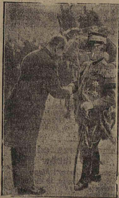
Burmistrz Medjolanu składa gratulacje królowi włoskiemu na placu wystawowym z powodu cudownego ocalenia.

Sensacyjne pogłoski berlińskie i medjolańskie. — Podejrzenie pada na anarchistów. — Liczne ofiary maszyny piekielnej. — Zmasakrowane dzieci. Cała Europa daje wyraz swemu oburzeniu z powodu niegodnego czynu.