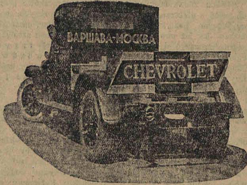
Na ilustracji powyższej widzimy samochód ciężarowy zmontowany w warszawskiej fabryce samochodów firmy „General Motors w Polsce”.

Zmontowany w Polsce Chevrolet przybył w dobrej formie do Moskwy.