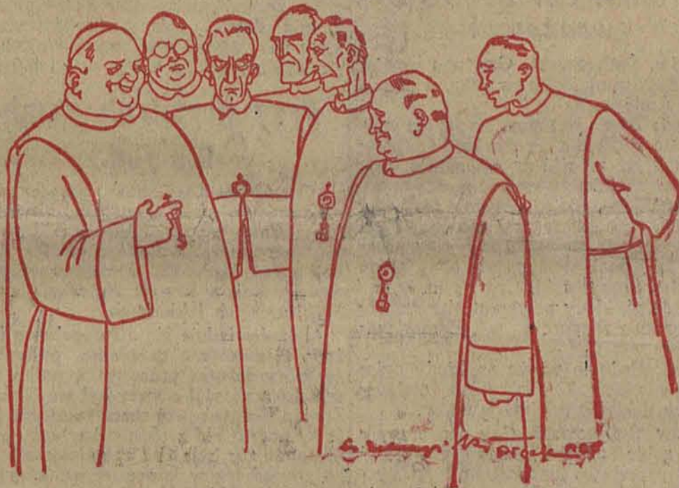
Grupa księży marjawickich.

Rysował specjalnie dla „Republiki” St. Dobrzyński.