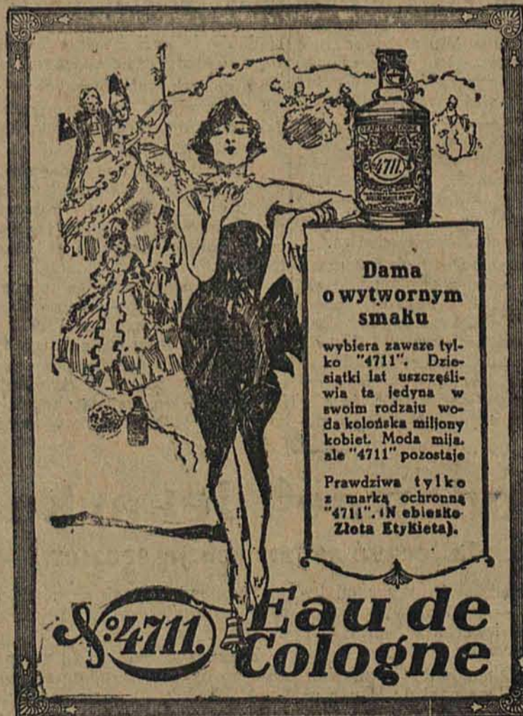
Wytwarzana całkowicie w Polsce przez generalnego zastępcę na Rzeczpospolitą Polską; firmę Zygryf Bochner i S-ka, Dziedzica.