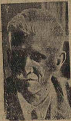
MARSZ. DASZYŃSKI premier rządu lubelskiego.

Po części muzykalno-wokalnej, ostatnie słowo wygłosił ponownie wiceprezydent Wieliński i przy chóralnym śpiewie „Czerwonego Sztandaru“ akademja została zakończona. (el)