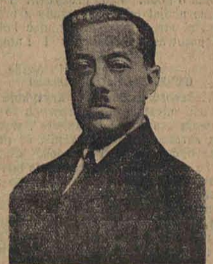
PREZ. ZIEMIĘCKI min. pracy rządu lubelskiego.