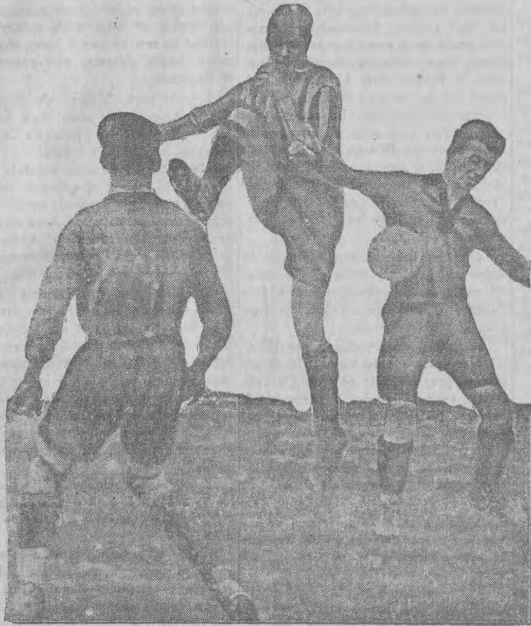
Fascynująca scena z meczu o mistrzostwo Wiednia piłki nożnej między pierwszymi drużynami klubów: Simmering — Vienna.

We wrześniu odbywać się będzie Zgromadzenie Ligi Narodów. Obecni na niem będą Mac Donald i Herriot. Na porządku dziennym jest sprawa rozbrojenia. Nie jest wykluczone, że i inne ważne sprawy nas dotyczące znajdą się na stole obrad. Przy całkowitem obniżeniu naszego prestige'u w Europie, do czego tak znakomicie przyczynili się pp. Sey-