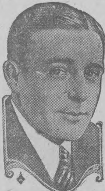
WALLACE REID in the Paramount Picture "NICE PEOPLE" a WILLIAM de MILLE production

MOTTO: Nowoczesne panienki są bardzo miłutkie. Mają kuse sukienki. Rozum i włosy krótkie