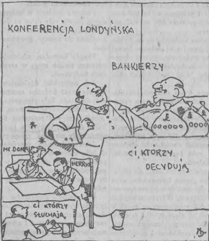
My rządymy światem, a nami bankierzy...

W ten sposób władze centralne zostaną odciążone, a procedura wydawania zyska na szybkości.