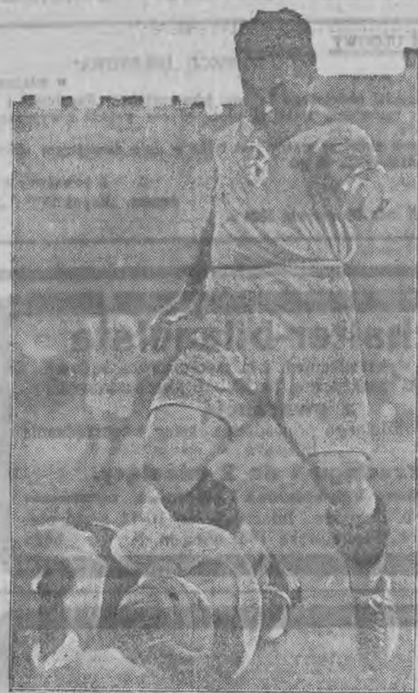
Epizod z meczu „Hertha“ — „Amatorzy“ w Wiedniu.