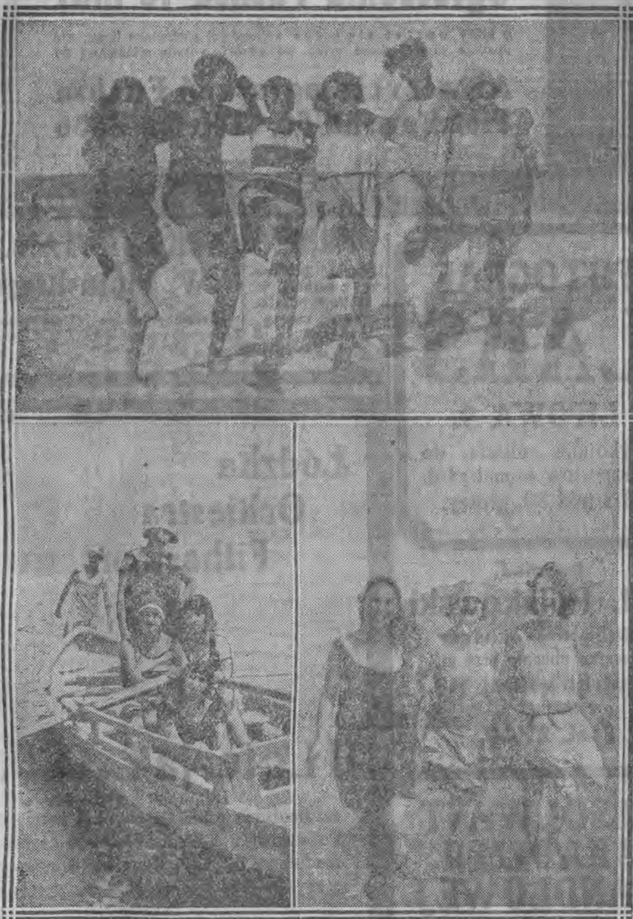
Grupa łodzianek i łodzian, hasających na plaży w Zoppotach.