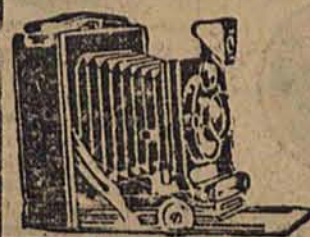
FOTO- i KINO-APARATY oraz wszelkie przybory poleca na dogodnych warunkach J. MORGENSTERN, Łódź, Piotrkowska 47 (w podwórzu) tel. 20-63

Dla pań i panów! Dla pań i panów! Koncesjonowane Zawodowe Kursy Kierowców Samochodowych Fr. Grętkiewicza Łódź, Al. Kościuszki 21 Telefon 75-35. Telefon 75-35 Liczne nowoczesne modele i pomoc szkolna Nauka jazdy na samochodach 6-cio i 8-cylindrowych Dogodne spłaty ratami. Porady fachowe bezpłatnie. Zapisy przyjmie kancelaria od 9-ej rano do 8-ej wieczorem jak również udziela wszelkich informacji. Od dnia 22 kwietnia przyjmujemy zapisy na kurs motocyklowy.