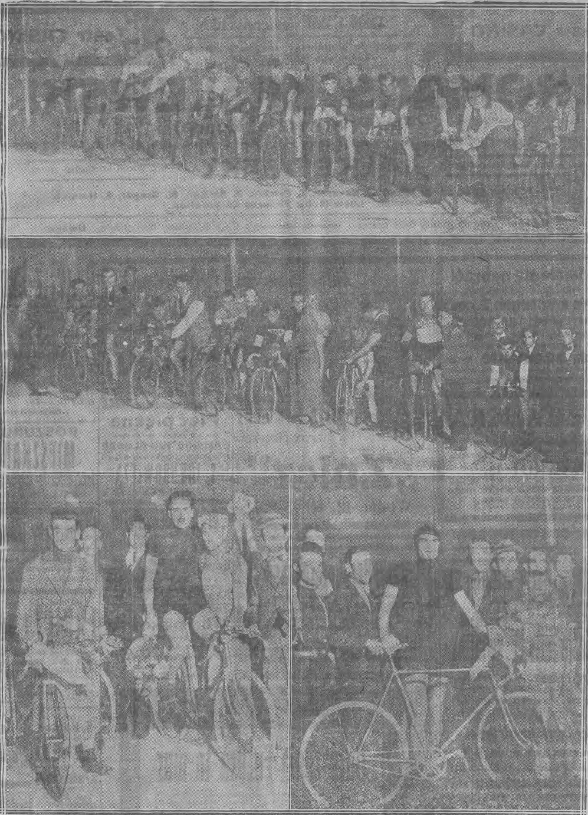
Zdjęcia z wyścigów o mistrzostwo cyklistowskie o tytuł mistrza Włoch północnych.